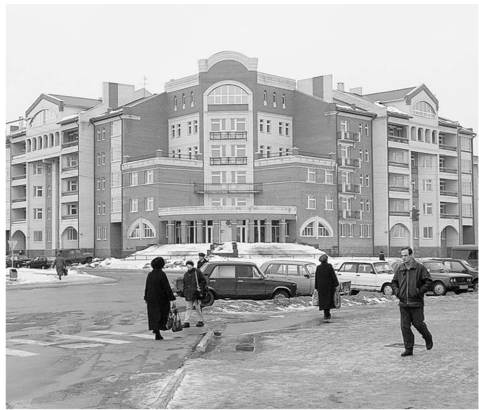
По итогам областного конкурса «Чистый город» в прошлом году первое место присуждено городу Лиски.