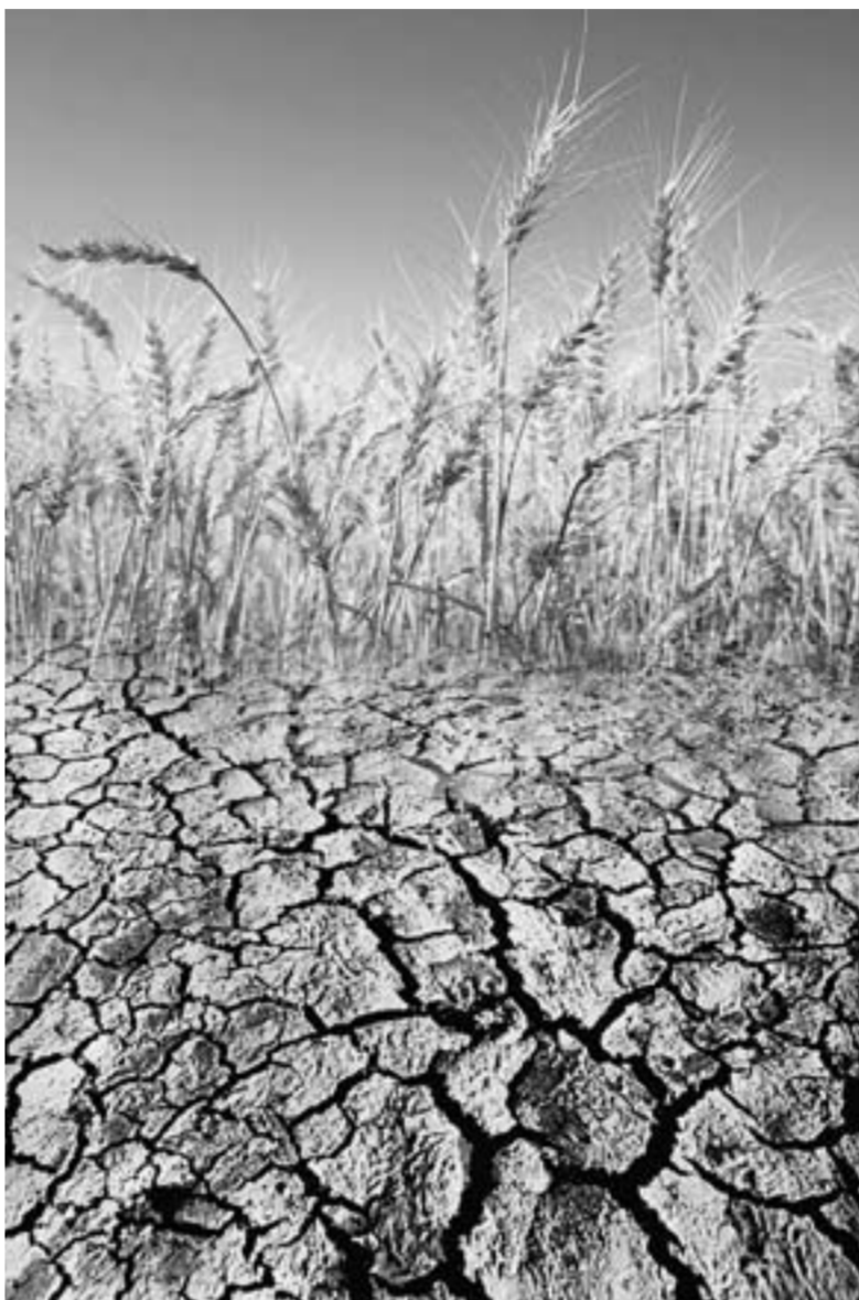
Такая земля не даст урожая.

По прогнозам же почвоведов, при нынешней деградации земли достаточно 15-20 лет, чтобы полностью разрушить чернозёмы. Это значит, потерять главное национальное достояние России. Землю надо спасать, ибо сейчас к ней потянулись алчные руки.