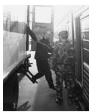
Этап заключённых загружается в вагон для перевозки.

начальник пресс-службы УФСИН