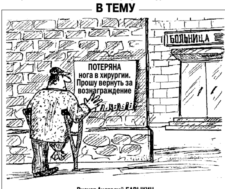
Рисует Анатолий БАВЫКИН