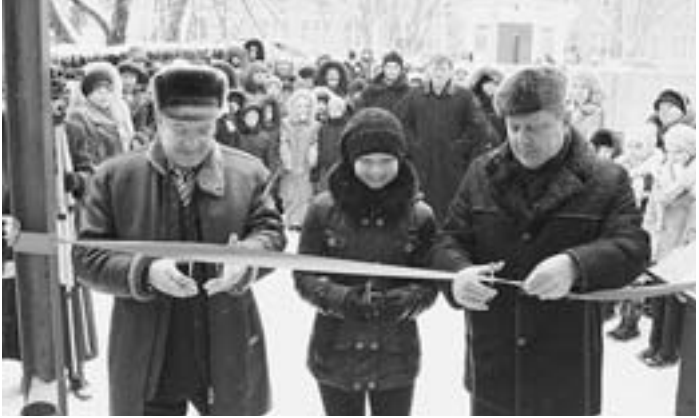
Открытие врачебной амбулатории в Шубное.

Капитальный ремонт здания сделали за несколько месяцев. Сегодня Шубинская врачебная амбулатория отвечает всем современным требованиям. Селянам созданы все условия для полноценного медицинского обслуживания, а у школьников есть теперь своя столовая.