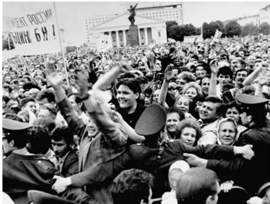
«Ельцина – в президенты!»