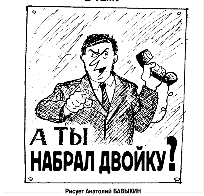
Рисует Анатолий БАВЫКИН