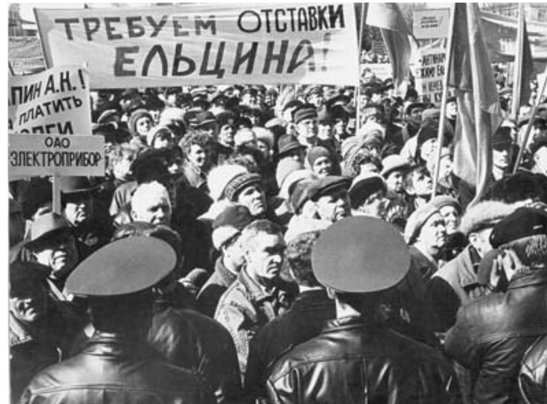
«Ельцина – в отставку!»