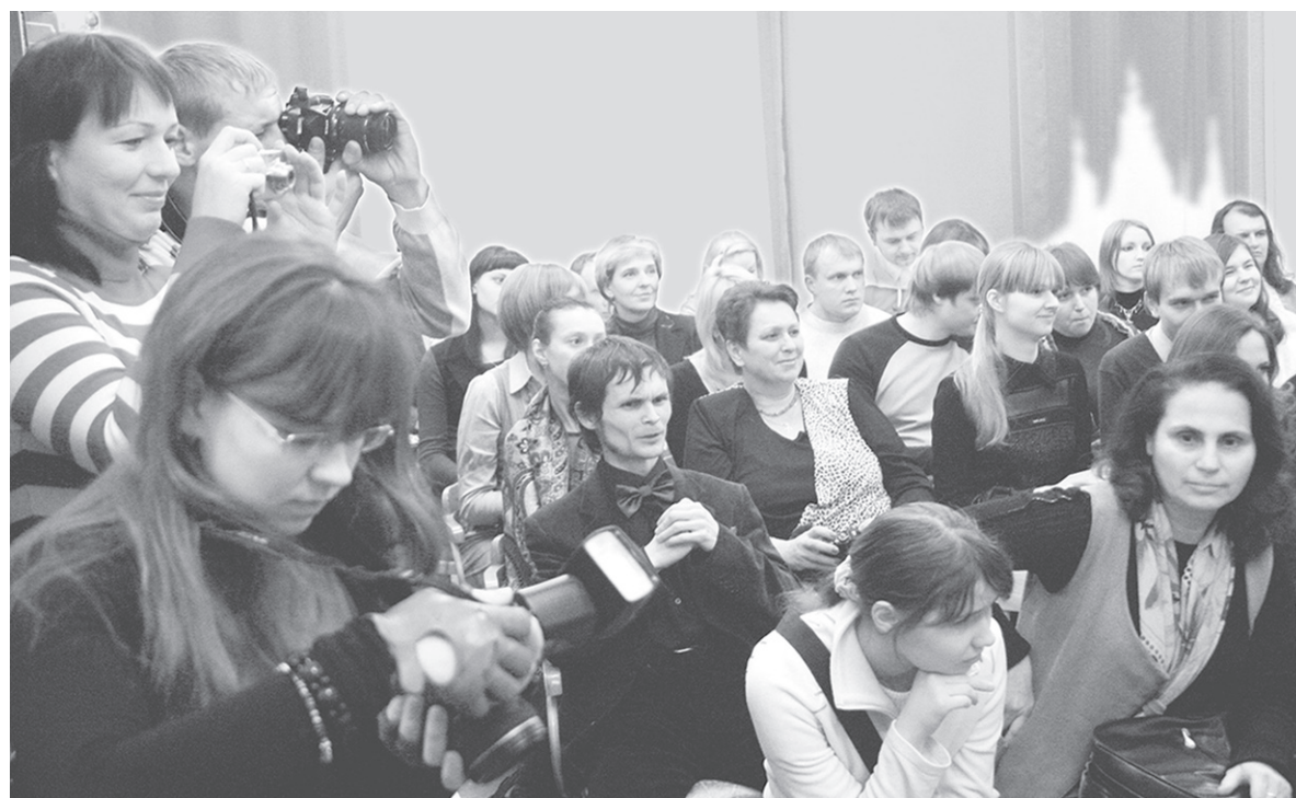
Идёт обсуждение стихов.

Кстати, по закону за предоставление адресно-справочной информации нельзя взимать госпошлину. Надеемся, что эта информация позволит воронежцам быть более бдительными и не попасться на уловку мошенников.