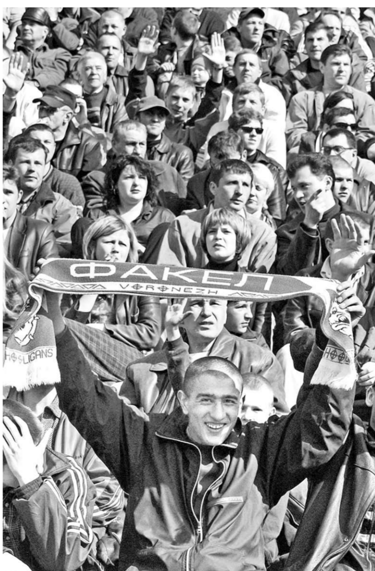
Болельщики готовы болеть!