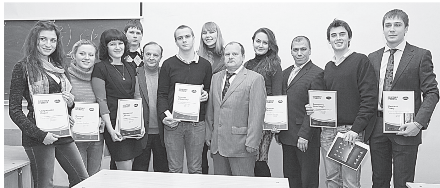
Победители конкурса и их наставники.

А к выбору работ жюри подошло строго и объективно.