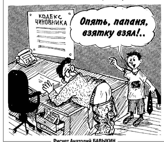
Рисует Анатолий БАВЫКИН