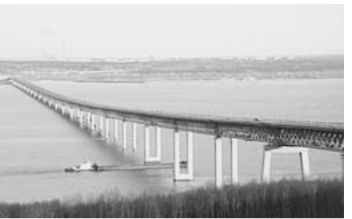
Мост через Волгу в Ульяновске.

- Хотелось бы большей стабильности. Понятно, что мы работаем в рынке и не можем в раз отлучаться от конкурентов. Тем не менее, удаётся рабо-