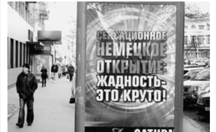
Подобными рекламными щитами заполнен весь Воронеж.

В одном из российских городов случился скандал. Жилищный комплекс под названием «Родина» выставили на торги.