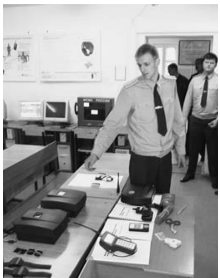
На занятиях в одном из учебных классов.

Кстати, офицерская столовая и парикмахерская сегодня действительно являются нашей визитной карточкой.