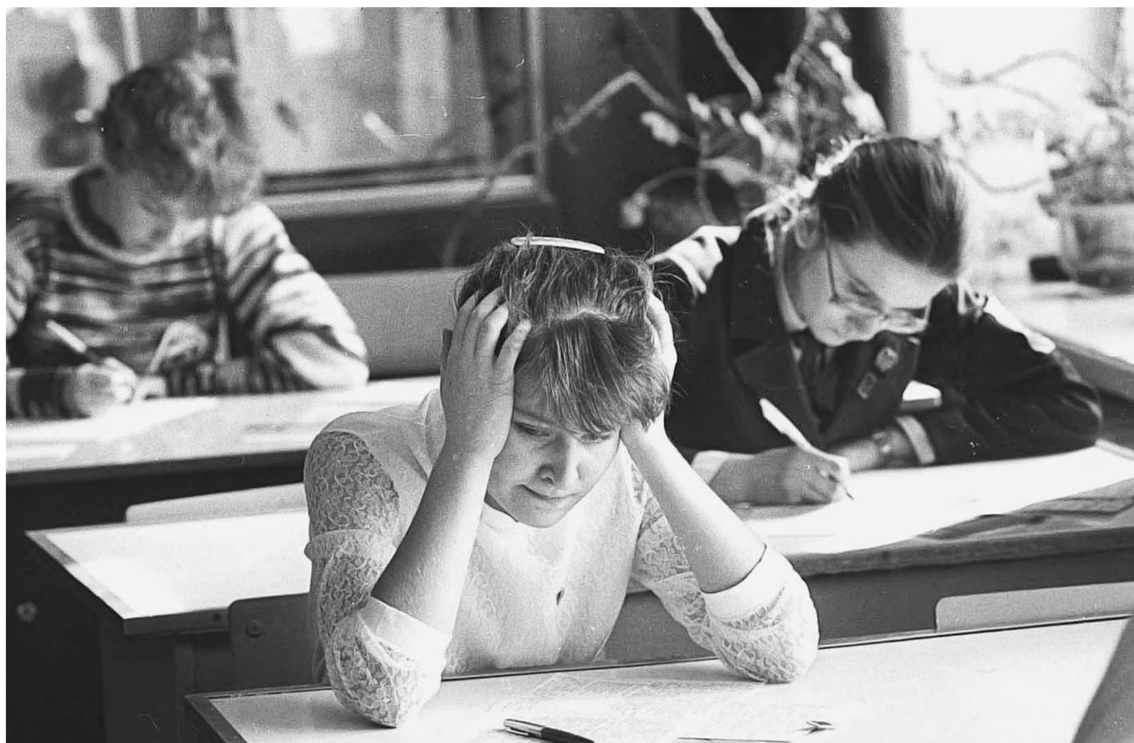
От предстоящей реформы впору схватиться за голову.

Образование | С этого года в российских школах начинается очередная реформа. До 15 февраля мы ещё можем в ней что-то изменить