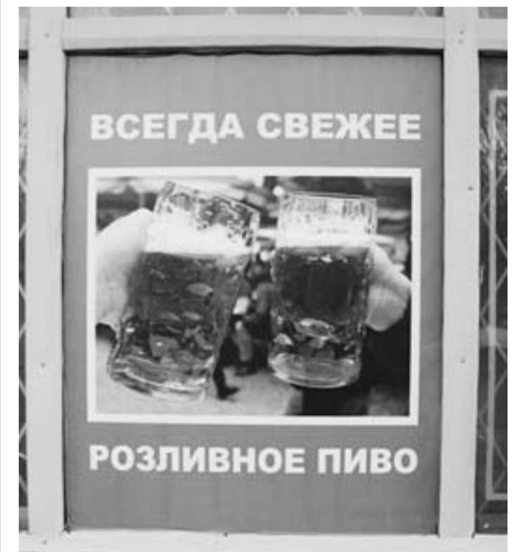
Реклама на остановке «Нефтебаза».