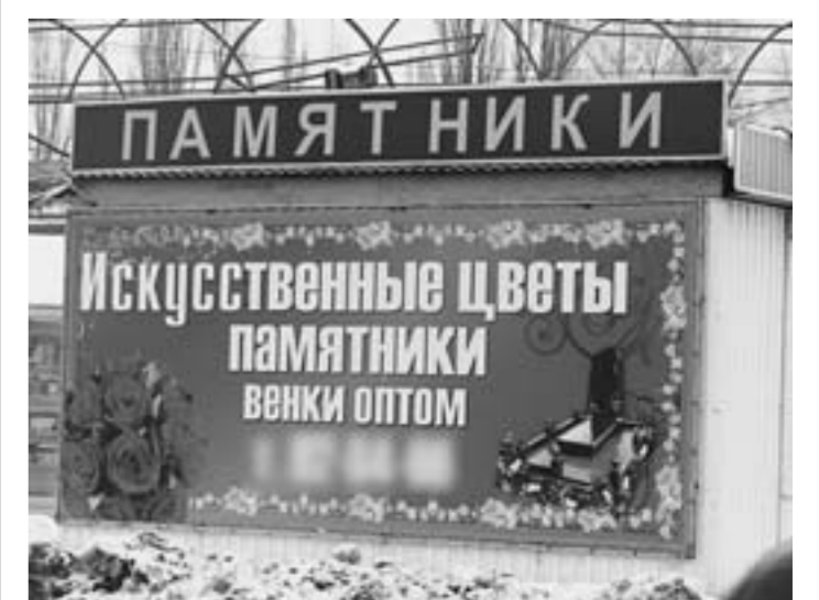
Раньше слово «искусственные» на этой вывеске было с одним «с». Теперь ошибку исправили.