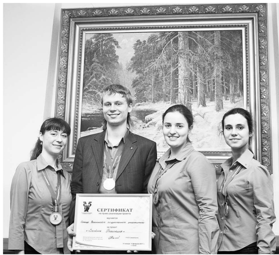
Участники акции «Зелёная революция».