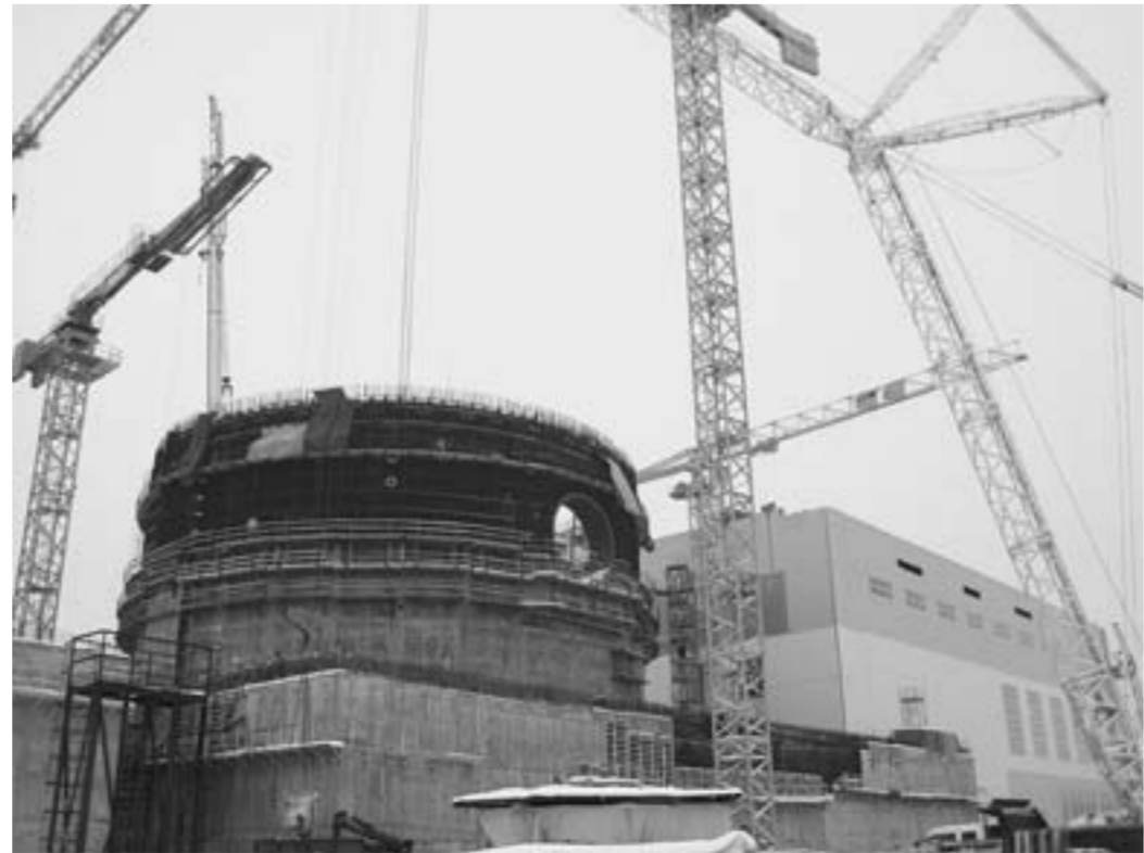
Реакторное отделение (блок №1).