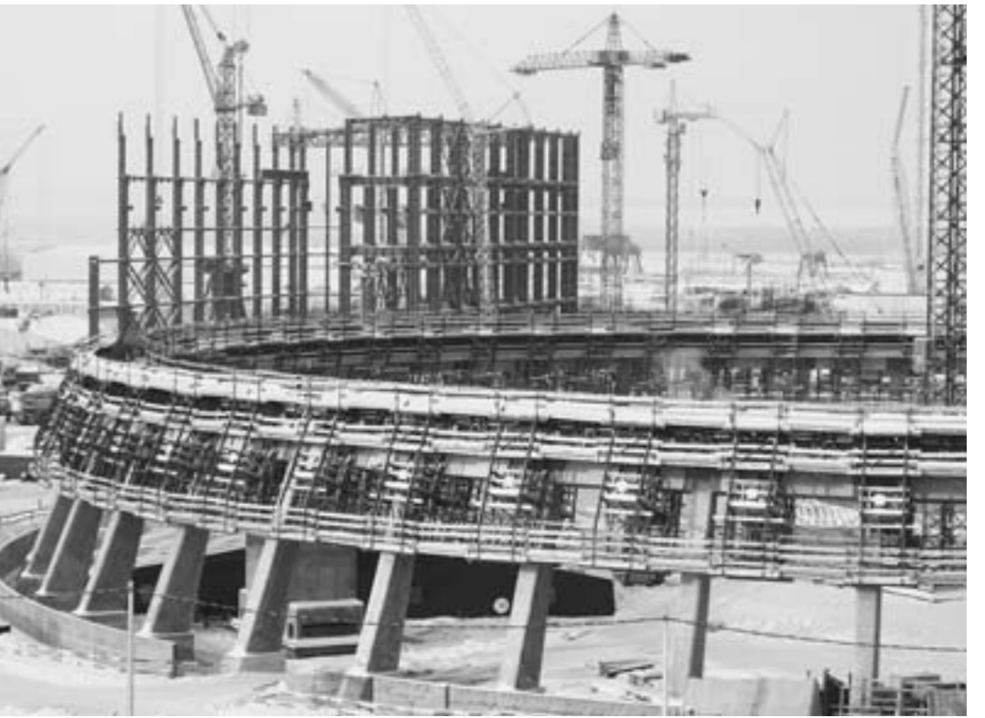
Сооружение башенной испарительной градирни.