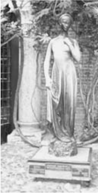
Терни - город святого великомученика Валентина и всех влюблённых.

тике написаны фразы о любви на разных языках, например: «Во сне как и в Любви нет ничего невозможного».