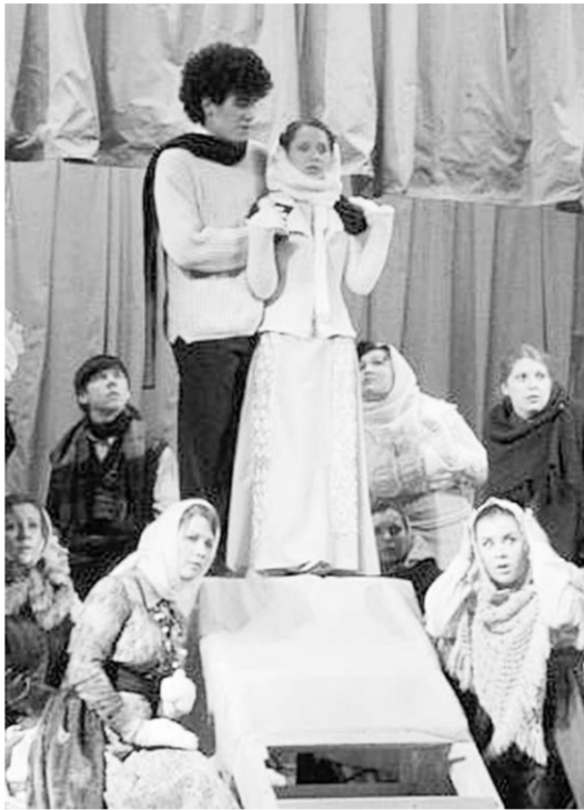
Репетируют «Шуточку» Чехова.

Занятия в студии бесплатные и проходят в Воронежском Дворце творчества детей и молодёжи. Актёрское мастерство ребята в возрасте от четырнадцати лет и старше осваивают за два года - на столько рассчитан курс. Но есть те, кто ходит сюда гораздо дольше. Сначала «курсанты» работают в одиночку: учатся держаться на сцене, входить в художественный образ, развивать пластику, речь. Потом ставят этюды группой в два-три человека. Идею