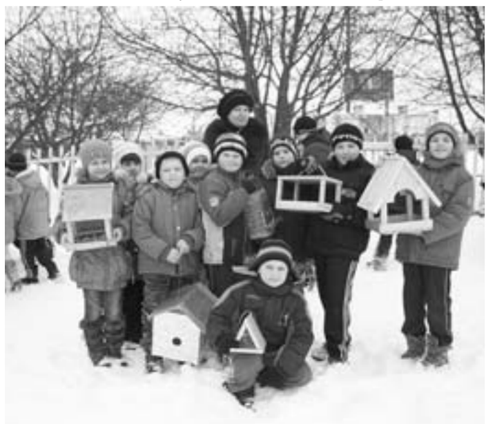
Ученики развешивают кормушки для птиц.

В Нижнедевицкой средней школе большое внимание уделяется экологическому воспитанию ребят. В зимнее время птицам очень нужна помощь людей. Поэтому здесь решили провести школьную акцию «Накорми птиц». В ней приняли участие ребята с 1-го по 8-й классы. Дома они изготовили кормушки. Вместе с классными руководителями развесили их в школьном саду. После того, как положили в них корм, долго любовались перышками. Теперь ежедневно следят за тем, чтобы у их подопечных были завтрак и обед.