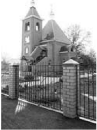
Церковь в Синих Липягах.

В храмах Нижнедевицка и Курбатова действуют воскресные школы. Ученики изучают основы православия, готовят концерты и спектакли на православные темы и показывают их прихожанам. А в церкви села Курбатова недавно прошел концерт духовной музыки.