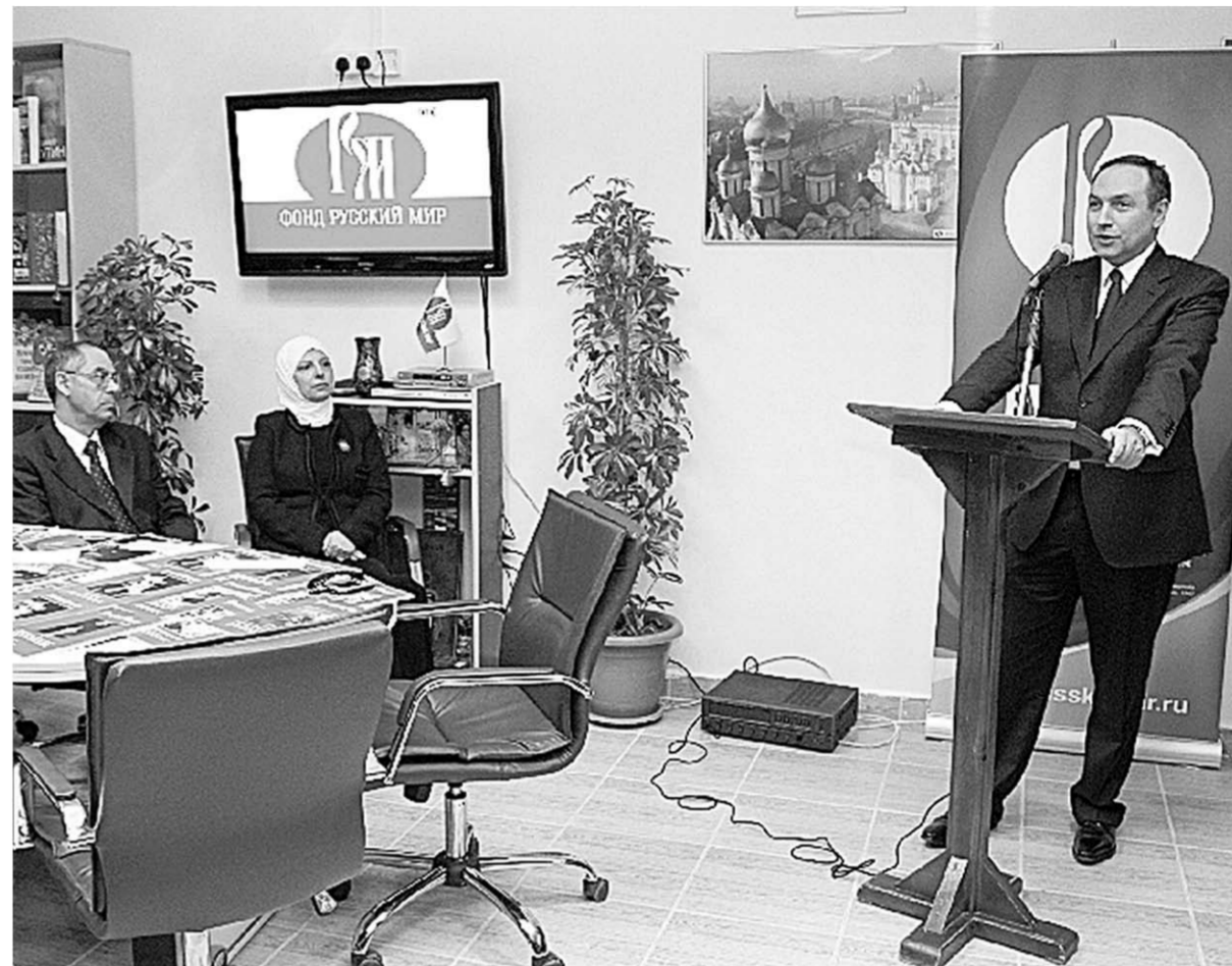
Вячеслав Никонов, руководитель фонда «Русский мир», выступает с приветственным словом на церемонии открытия «Русского центра».