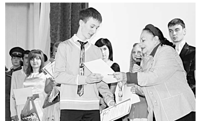
Победителей поздравляет известный знаток и пропагандист народной песни Наталья Масалитинова.

Кто вам сказал, что песни военных лет не любят нынешние двадцатилетние, что «Три танкиста» или «Тёмная ночь» - давно забыты?