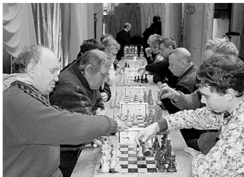
и призеры от политической партии «Справедливая Россия» получили кубки, медали, грамоты и денежные призы.