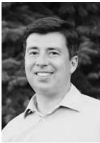
Юрий ИСАЕВ, депутат Государственной думы РФ от Воронежской области, член Генсовета партии «Единая Россия».

От всей души поздравляю вас с Днём 8 Марта! В нашей стране Восьмое марта традиционно является днем, ставшим символом весны, любви и гармонии.