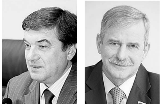
Глава городского округа город Воронеж С.М. КОЛИУХ Председатель Воронежской городской думы А.Н. ШИПУЛИН

Примите наши искренние и сердечные поздравления с самым красивым праздником - Международным женским днем 8 Марта!