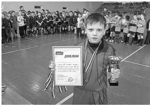
«Стрела». Победителям, занявшим первое место, от партии «Справедливая Россия» были вручены наборы мячей, а также команды получили грамоты, медали, кубки и сладкие призы.

Участники разделились на две подгруппы: среди юношей 2000 г.р. победу одержала команда ФК «Воронеж», а среди юношей 2001 г.р. – ФК