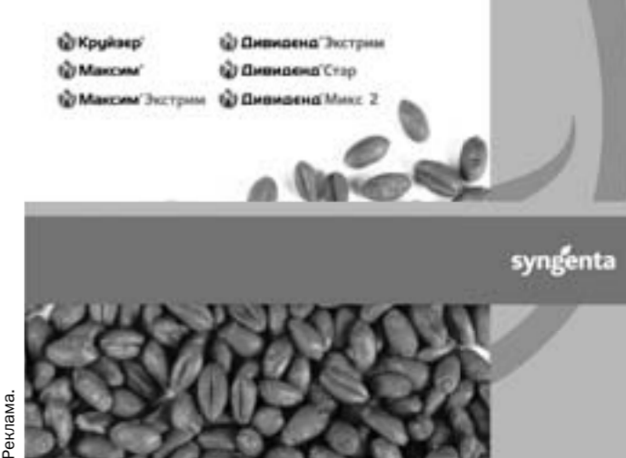
Розыгрыш 10 учебно-развлекательных поездок в Швейцарию

Трудности в борьбе с вредителями? КРУЙЗЕР® все шире используется на зерновых, инсектицидный протравитель на основе уникального д.в. – тиамотоксама. Это дает возможность хлеборобам решить вторую составляющую успеха в защите зерновых – эф-