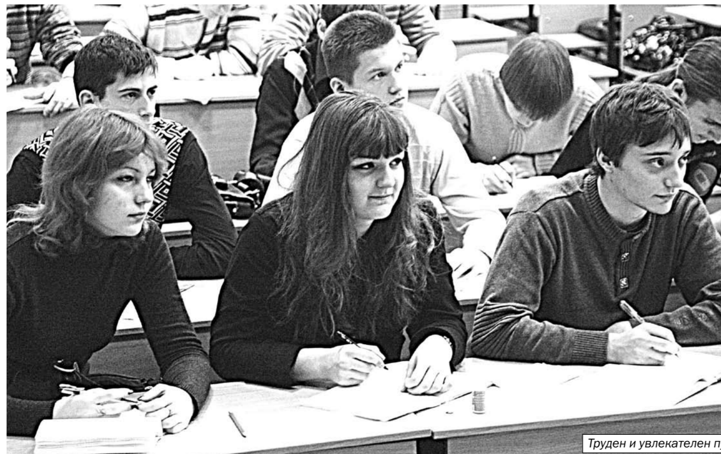
Труден и увлекателен путь к будущей профессии.