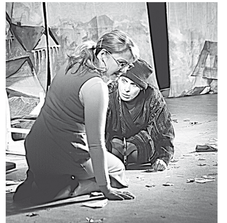
Сцена из спектакля.

А в память о А.А.Хованском в Воронеже появилась мемориальная доска – на месте, где находился его дом.