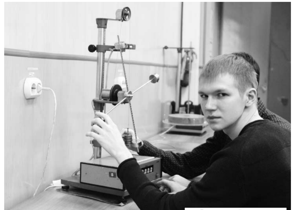
До открытий – один шаг.