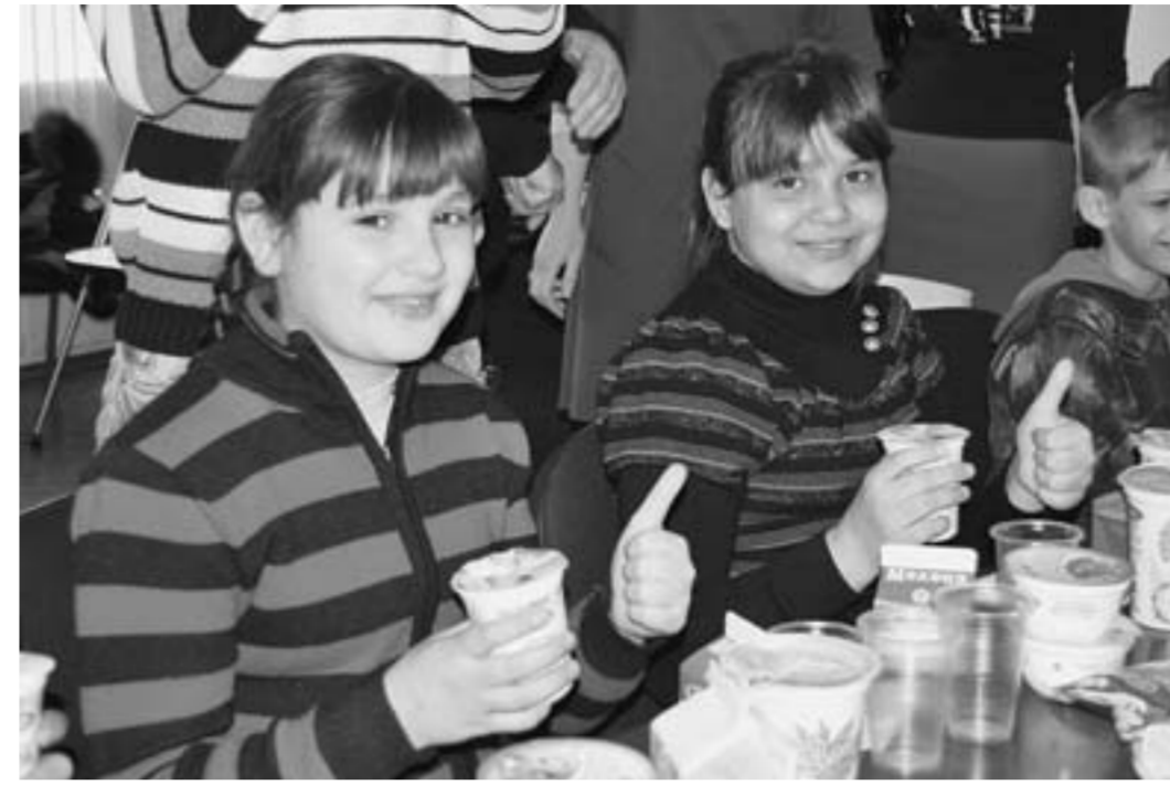
Ребята из села Копёнкино в гостях на молочном заводе: молоко что надо!

Есть ещё одна особенность у россошанского «Детского». Натуральное коровье молоко здесь готовят к розливу методом пастеризации. Несколько десятков секунд его прогревают при температуре 85 градусов, но не выше. При этом погибают вредные бактерии, грибки, но сохраняются полезные бактерии и витамины. Молоко остаётся «живым, а не мёртвым», как при переработке его другим способом. Если его стерилизуют: кипятят при температу-