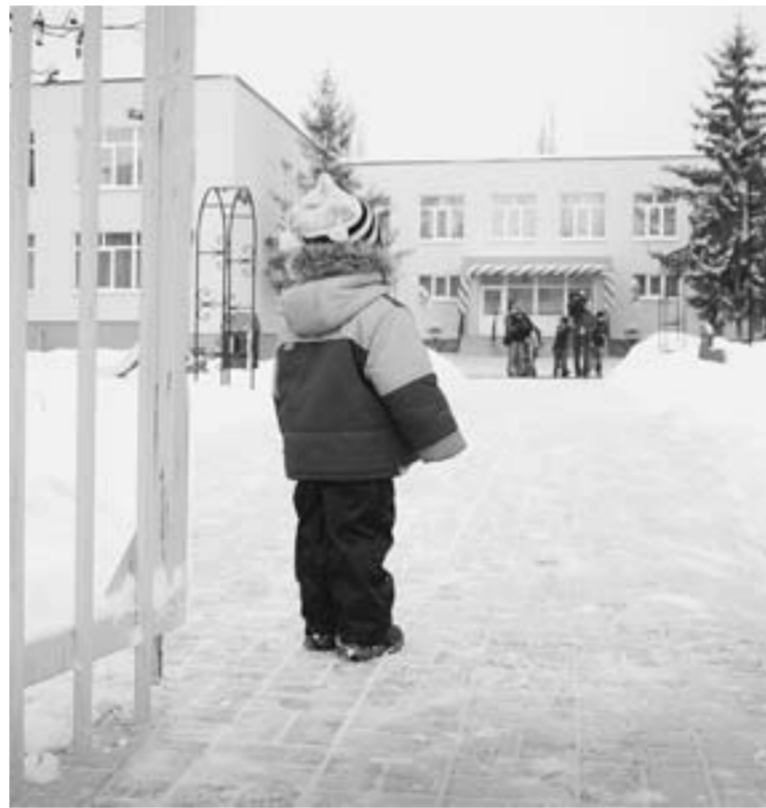
Вход в детсад разрешён?

В алентина Сергеевна очень любит охотиться. Причём география её интереса простирается далеко за пределы области и страны. Как-то она умчалась на охоту в джунгли Амазонки, потом расчленила ружьё в предгорьях Гималаев, а последние рождественские каникулы провела на сафари в Кении. Есть такие