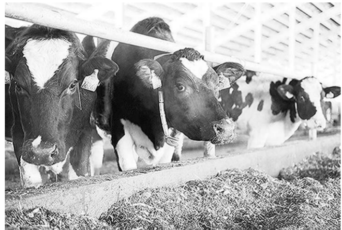
Белорусов заинтересовал опыт воронежцев в развитии животноводства.