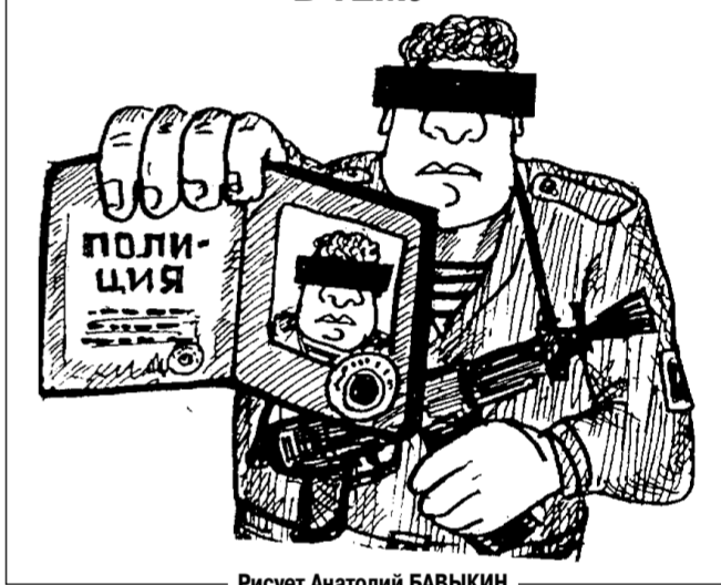
Рисует Анатолий БАВЫКИН