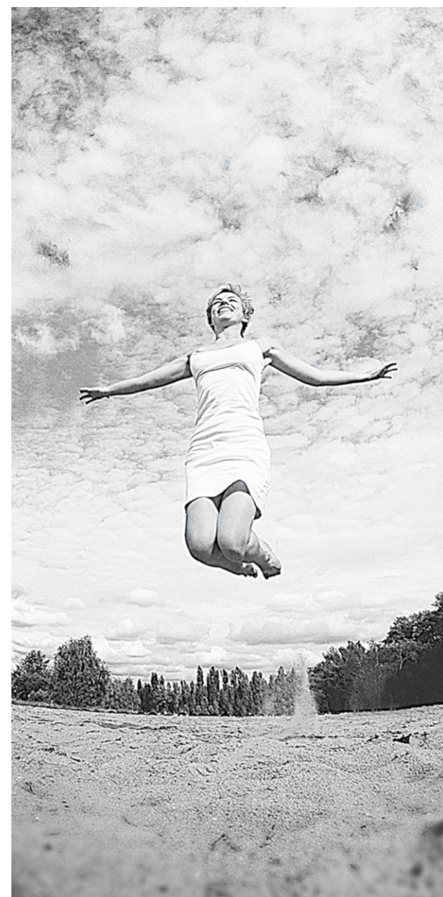
Можно ли прыгнуть выше своей головы?

Познавая себя | Всё ли в наши дни зависит от одного желания?