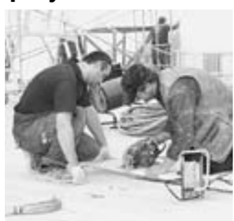
Идёт ремонт спортзала.