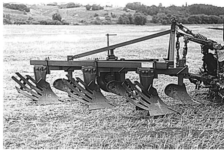
Трёхкорпусной навесной плуг ПНС 3-45.