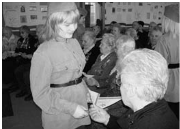
На встрече с фронтовиками.

«Я помню, я горжусь!» - под таким девизом чествовали фронтовиков в музее боевой славы в школе №1. Яркой и трогательной получилась и церемония открытия тематической выставки «Бесмертные в памяти наших сердец», которую подготовили поисковики отряда «Пересвет» в музее Нововоронежской АЭС. Побывали ребята и там, где в 1942-1943 годах держали оборону бойцы 141-й Стрелковой дивизии. И стар и млад почтили память тех, кто не пощадил своей жизни ради нас, ныне живущих.