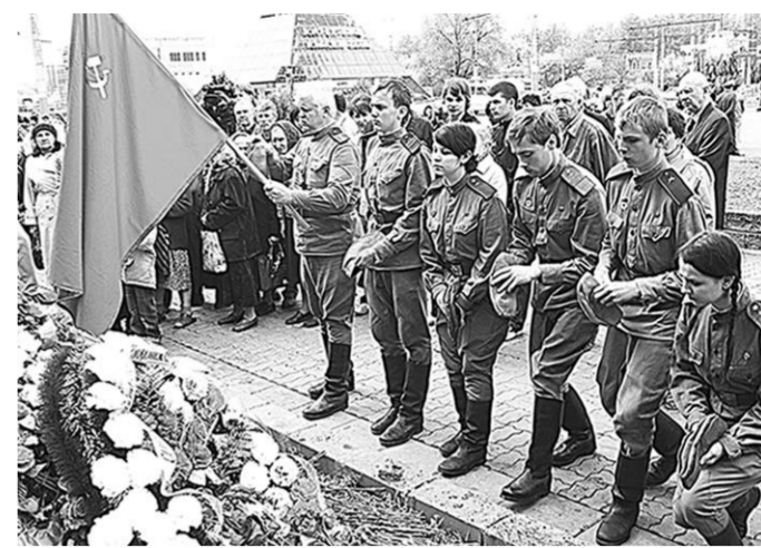
Военно-патриотический клуб «Набат» – непременный участник воронежских праздников.