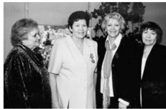
Активисты женсовета на 1-м областном съезде женщин Воронежской области, 2007 год.

Дата | Воронежскому областному женскому совету исполняется 30 лет