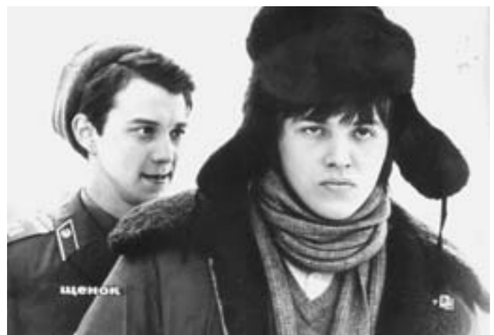
Кадр из фильма «Щенок».