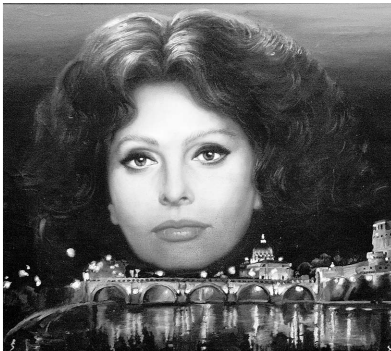
Портрет Софи Лорен.

«Достаточно одной картины, чтобы получить удовольствие. У Пукирева был, например, «Нервный брак». А у Леонардо, кроме портрета Джоконды, - и неудачные работы. Может быть, не всё на выставке вам понравится. Я экспериментирую, пробую. И получаю