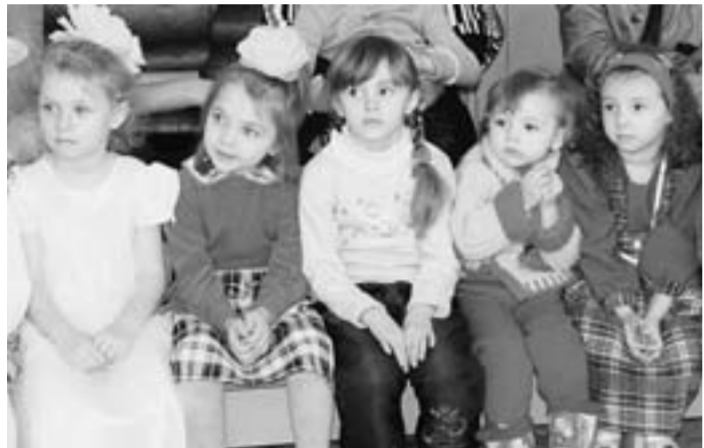
Воспитанники нового детского сада.

В Калаче открыт новый детский сад №6. Пока здесь 40 мест, но рассчитан он на 75 мест. Реконструкция обошлась администрации Калачевского района почти в два с половиной миллиона рублей. Значительную помощь в этом деле оказали спонсоры и глава администрации городского поселения Татьяна Мирошникова. Разработана в районе и программа по дальнейшему сокращению очередей в дошкольные учреждения.