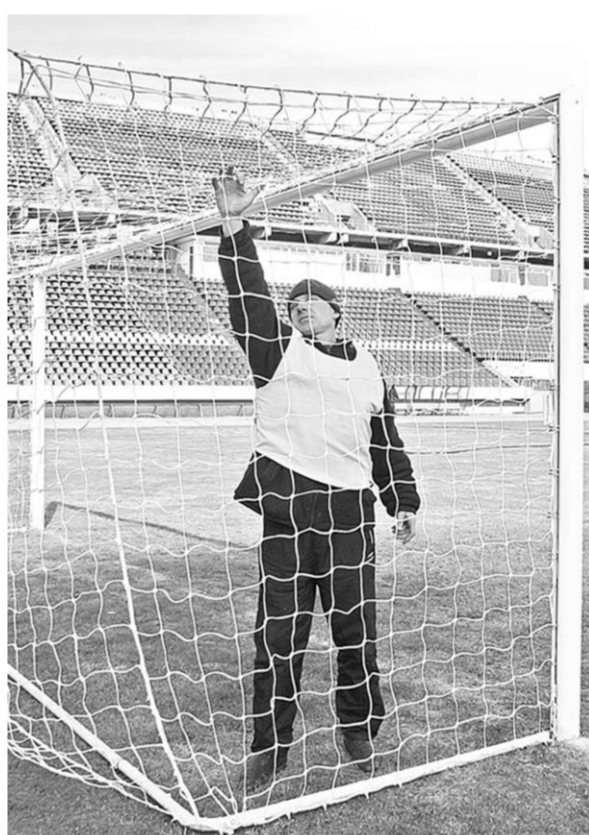
О встрече болельщиков и команды «Факел» - на 4-й странице