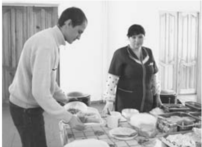
На обед – в кафе техникума.

Не так давно открылся пункт горячего питания для студентов Калачевского техникума. Дирекция учебного заведения вместе с руководством местного кафе решили проблему полноценных обедов. Теперь у студентов появилась возможность сравнительно дешево и вкусно питаться. Комплексный обед обходится в 60 рублей. Столуются тут и преподаватели техникума, не избалованные высокими зарплатами.