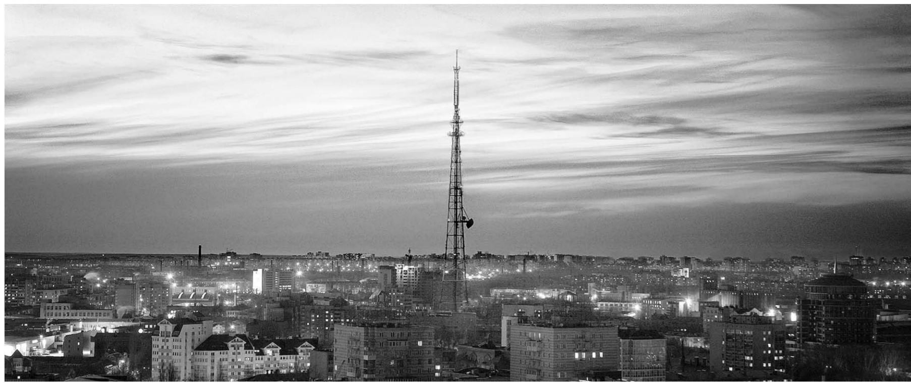
Воронеж с высоты птичьего полёта.