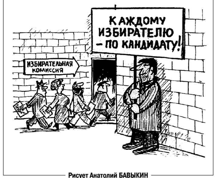
Рисует Анатолий БАВЫКИН