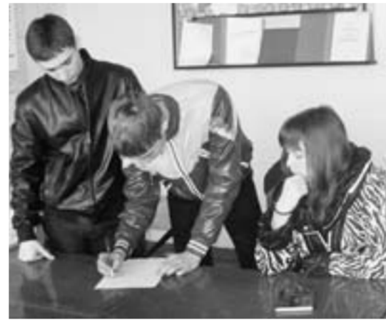
Инициатива - делу помощник.