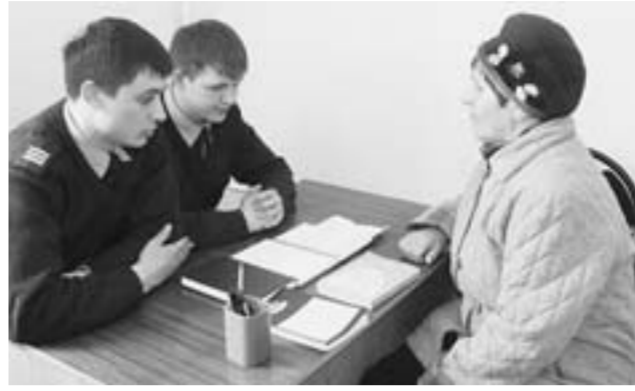
Приём ведут курсанты.