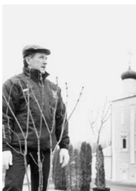
На субботнике – Алексей Гордеев.