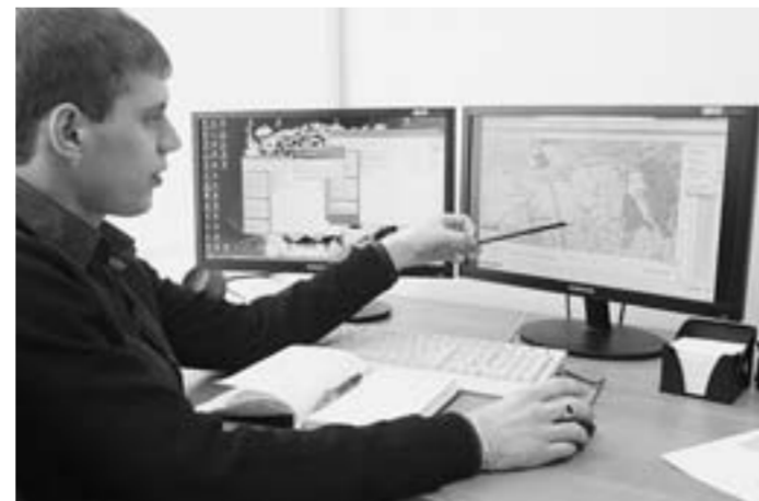
Работа начинается у карты области. Продолжается – на полях.

колоссальной работы налицо: на сегодняшний день в агропредприятиях практически отсутствует в эксплуатации техника старше шести лет. Большая часть машинотракторного парка – импортная техника не старше трёх лет, включая один из самых эффективных в мире свеклоуборочных и свеклопогрузочных комплексов фирм ROPA и Holmer. На сахарном заводе ежегодно проводится модернизация оборудования, что позволило достичь объёмов переработки в 3 тысячи тонн сахарной свёклы в сутки. К 2015 году его мощность увеличится практически в два раза – до шести тысяч тонн в сутки. Намеченная модернизация производства начнётся уже в этом сезоне. С этой целью приобретён новый диффузионный аппарат, запланировано строительство жомоусильного отделения с грануляцией.