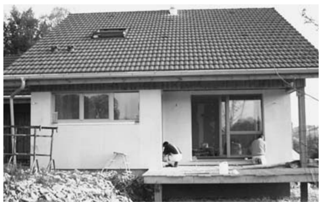
Тёплый дом и красив и экономичен.

Как говорится, чисто не там, где убирают, а там где не мусорят. Тот же принцип и с энергией, которую мы, наконец, понемногу учимся экономить.