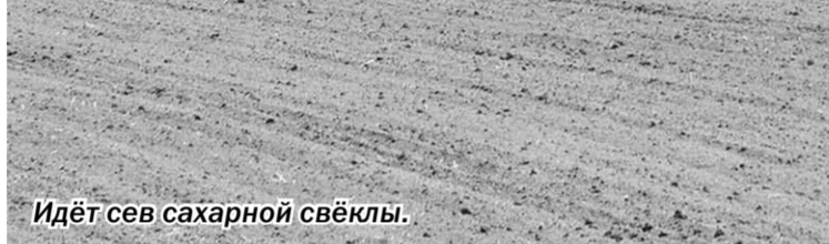
Идёт сев сахарной свёклы.

Выехав в поле всего несколько дней назад, земледельцы ООО «Агротех-Гарант Нащекино», что в Аннинском районе, уже завершили сев гороха, яровой пшеницы и ячменя. В разгаре — сев сахарной свёклы. Она, как и принято в Аннинском районе, займёт солидную площадь — 500 гектаров.