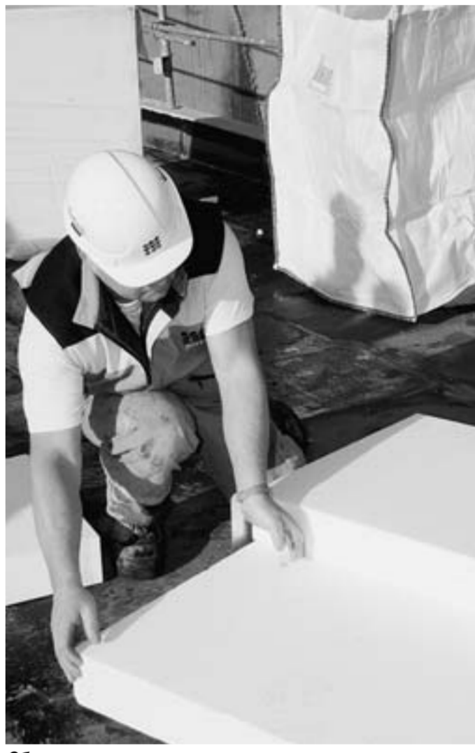
Сберечь тепло легко и просто.

Красота, комфорт и... экономия Кстати, пенополистирол – лучший материал для утепления не только многоэтажек,