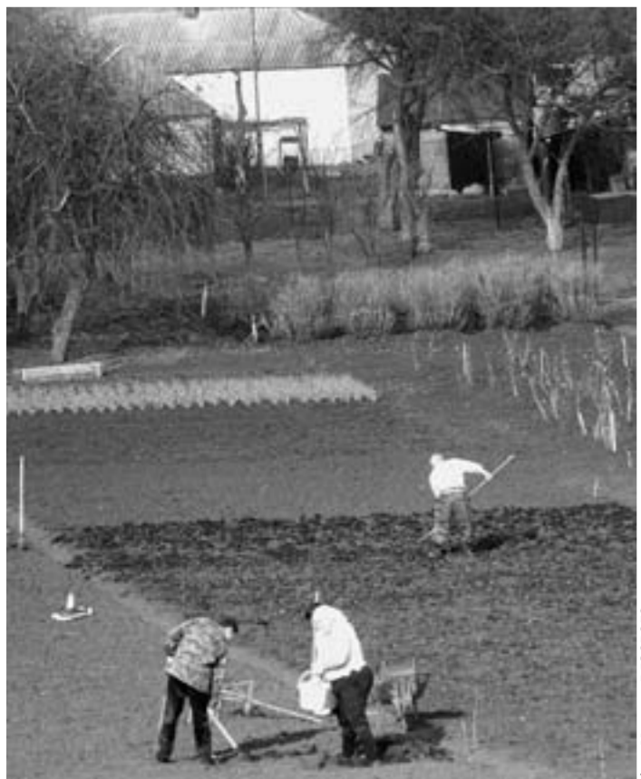
Для очень многих воронежцев первомайский праздник – это возможность поработать в саду и на огороде.

- В этот день, к сожалению, далеко не праздничные мысли. Мы будем участвовать в демонстрации с лозунгами и требованиями достойной жизни для работников бюджетной сферы, государственной поддержки пенсионерам и студентам, бесплатного качественного образования. Сегодня Первомай – это день, когда трудящиеся ещё раз могут заявить о своих правах, символ единения и солидарности людей, это – надежда на позитивные перемены в жизни трудящегося человека. Этот праздник ассоциируется с важными человеческими ценностями – свобода и справедливость, обновление и взаимная поддержка, понимание и согласие. Не случайно в этом году его будут отмечать в 160 странах мира.