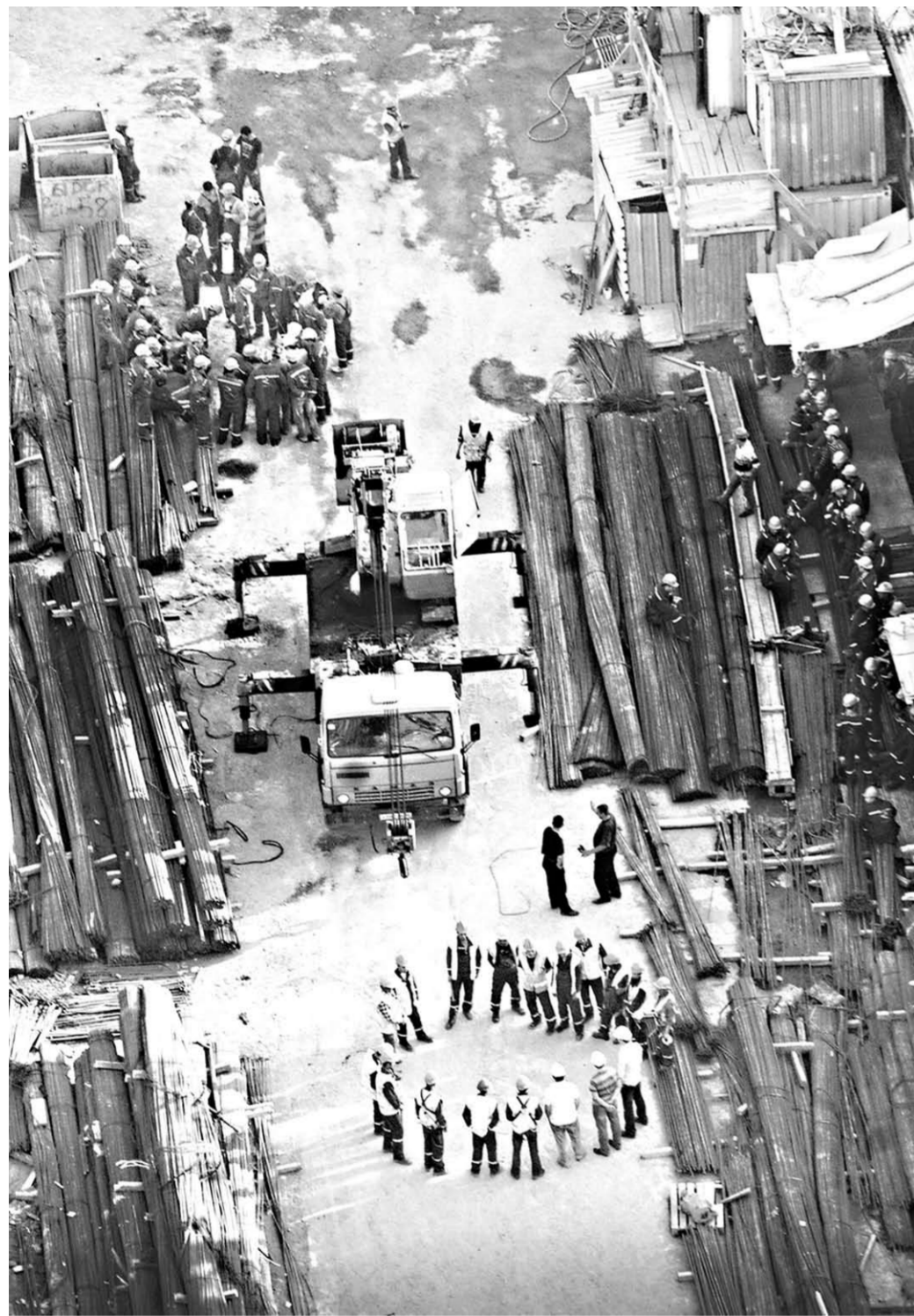
У строителей перекур.

В отечественных клиниках в этих случаях больным показана исключительно сложная полостная операция. Но наука на месте не стоит. То, что вчера казалось фантастикой, сегодня становится реальным. В Германии, например, прошла первая в мире успешная фрагментация камней слюнных желез. Специалисты воронежской поликлиники, освоив технологию по дроблению мочекаменных, прорабатывают и новые методики.