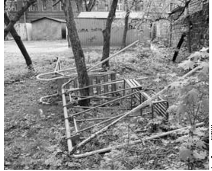
На этих качелях не покатаешься.