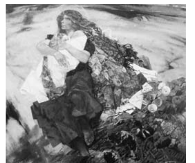
Одна из картин триптиха.