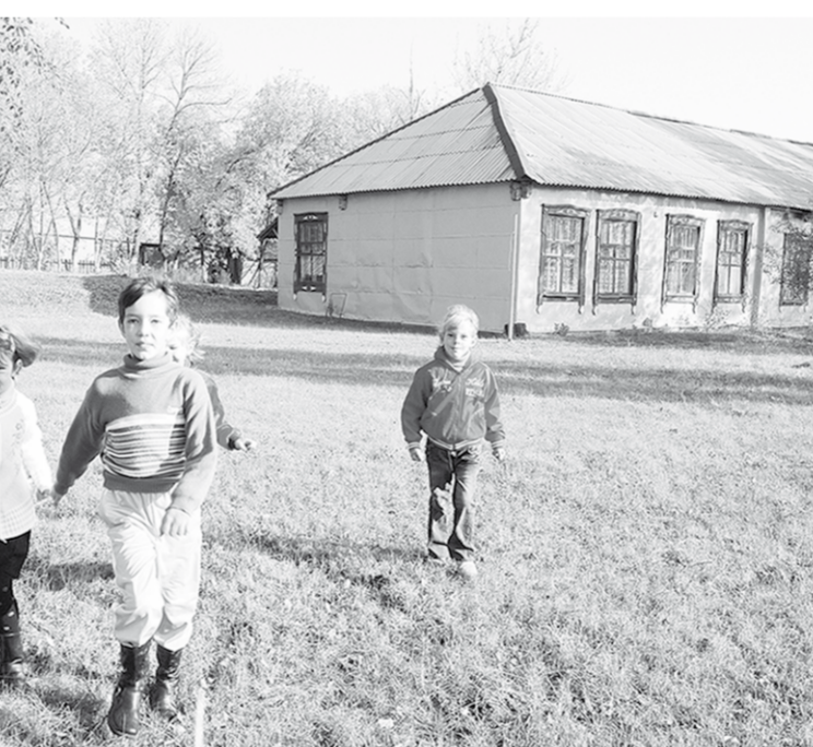
Школа в селе Рудкино Хохольского района. Как ей и другим скромным сельским школам вписаться в новые нормы?

С первого сентября 2011 года условия и организация обучения наших чад в школах должны измениться до неузнаваемости. А поможем им в этом новые санитарно-эпидемиологические правила и нормативы, утверждённые главным санитарным врачом страны. В них учтено всё: от требований к размещению здания до режима образовательного процесса и медицинского обслуживания. Действовать они будут во всех школах без исключения: старых и недавно построенных независимо от их формы собственности. Ими должны руководствоваться при строительстве новых и реконструкции морально и материально устаревших зданий. Итак, теперь строить школьные здания можно только на внутриквартальных территориях жилых микро-