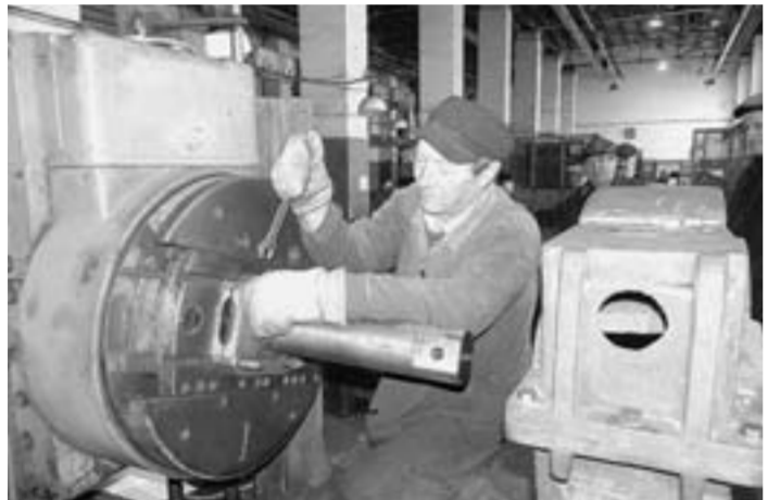
В цеху ремонтно-механического завода.

Митрофановский ремонтно-механический завод налаживает сотрудничество с ОАО «Рудгормаш». Уже в апреле по чертежам воронежского машиностроительного предприятия были сделаны корпуса редукторов для шахтного оборудования весом около 300 килограммов. Здесь также изготавливают стальные колёса к нему. Однако есть комплектующие, которые завод сам изготовить не может. Их поставит «Рудгормаш».