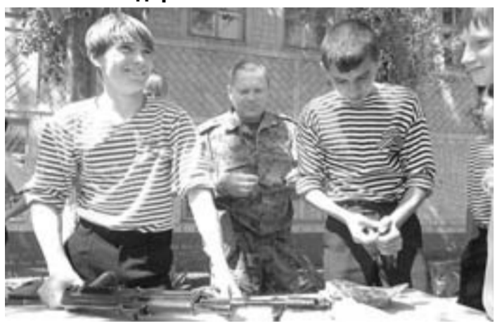
За разборкой и сборкой автомата.

Мальчишки и девчонки из школ Кантемировского района приняли участие в четвертом районном фестивале-конкурсе «Молодые патриоты своей страны». Сначала состоялся смотр строя и песни. А затем ребята соревновались в разборке и сборке автомата, участвовали в викторине «А музыка не молчали». Существенную поддержку в организации фестиваля-конкурса оказали стражи границы. Пограничники никогда не остаются в стороне, когда дело касается воспитания подрастающего поколения.