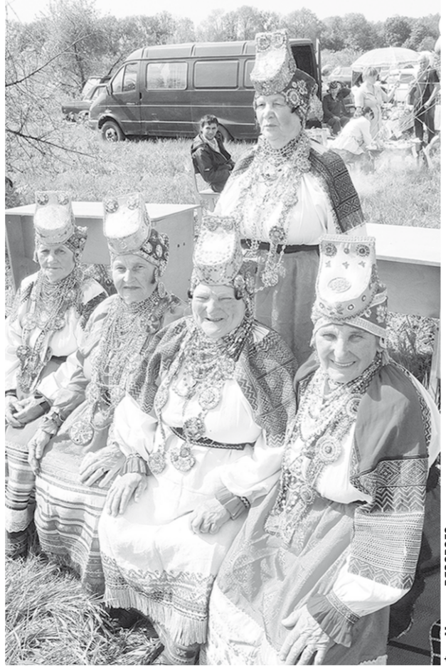
Фольклорный ансамбль «Крестьянка».

Губернатор Воронежской области А. В. ГОРДЕЕВ Председатель областной думы В. И. КЛЮЧНИКОВ