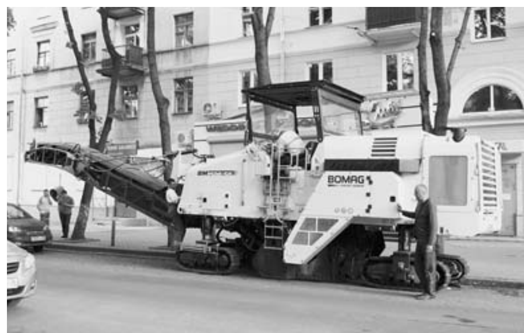
Техника, гарантирующая качество.