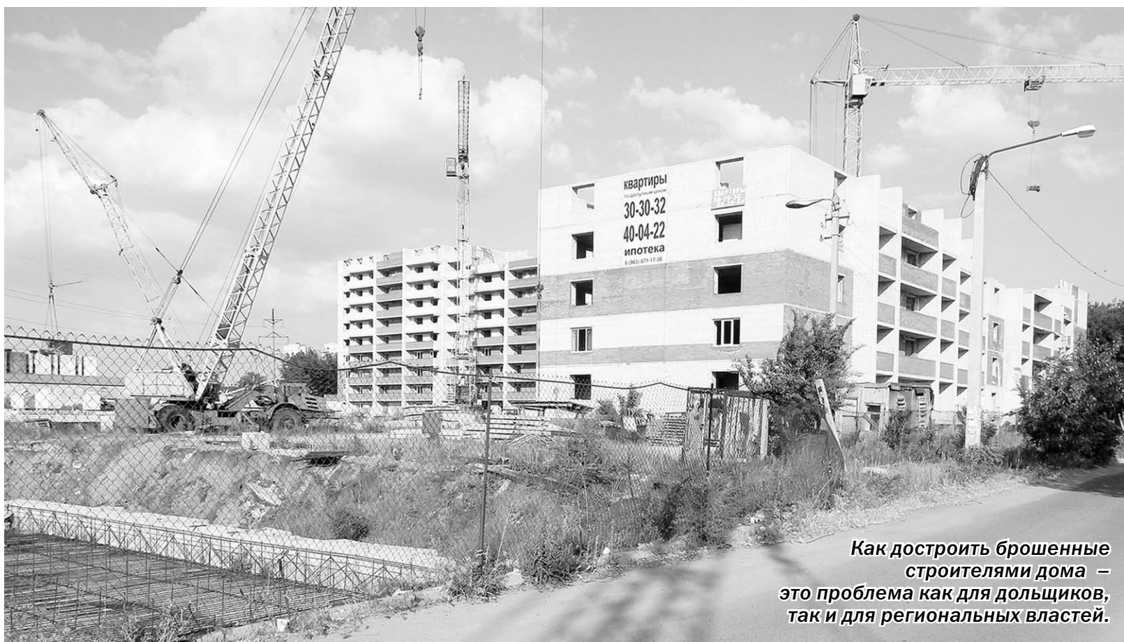
Как достроить брошенные строителями дома – это проблема как для дольщиков, так и для региональных властей.

Ситуация | Обманутым дольщикам «Золотого кольца» предложено вложить 3 тысячи 300 рублей за метр будущего жилья, чтобы достроить многоквартирный дом