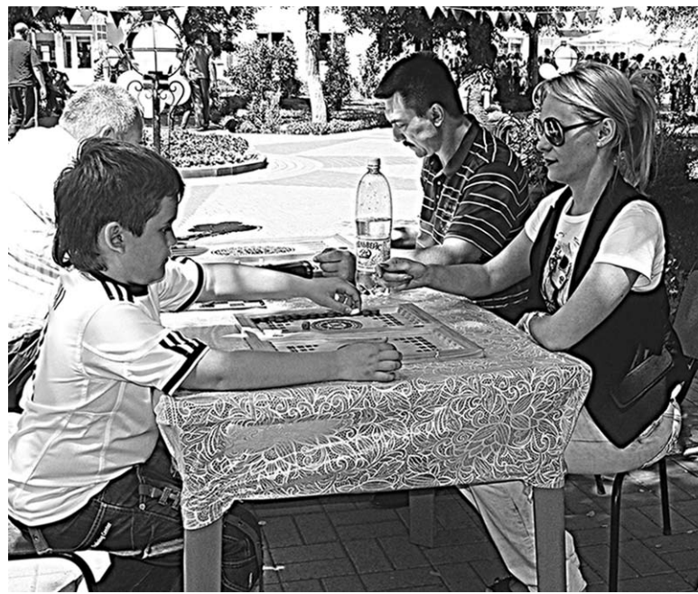
Нардам все возрасты покорны.