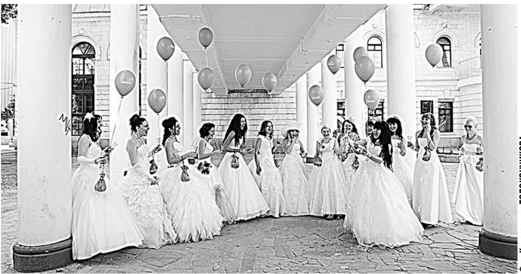
Нечасто можно увидеть такое количество невест одновременно.

проект. Главное, к чему стремились они – создать и получить много ярких впечатлений и позитивных эмоций. Об этом оригинальном проекте тогда написали в одном крупном женском журнале, после чего идею подхватили и другие города. В 2009 году таковых было 12 и около 400 сбежавших невест, в 2010-м – более 20 городов, а в нынешнем – ещё в два раза больше, в том числе впервые оказался и Воронеж. К своему дебюту воронежские невесты начали готовиться задолго до самого мероприятия, почти как к настоящей свадьбе. Платья, туфли, макияж и причёски – всё это и многое другое обговаривалось с организаторами. Продумывалась до мелочей и маршрут, по которому девушки «бегут». В заключение маршрута, на площади Ленина, сбежавших невест ждал шикарный лимузин. Девушки катались по городу, фотографировались