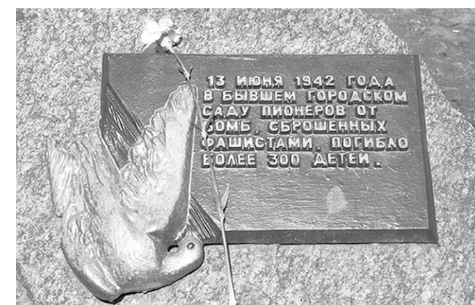
Уже 69 лет прошло с момента трагедии в воронежском Саду пионеров. Тогда, в июне 1942 года, при бомбардировке сада фашистами погибли более 300 детей.