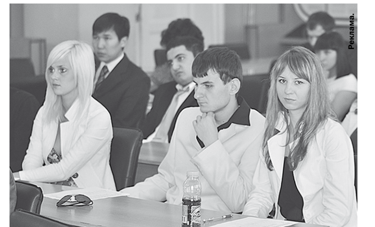
Учиться – дело серьезное.

Полагаем, что, усилив управленческую подготовку выпускаемых ВГАУ специалистов по естественным отраслям сельского хозяйства, мы облегчим региональным властям всех уровней и аграрное задание подбора кадров руководителей. Имеются планы усиления управленческой подготовки в рамках системы повышения квалификации и переподготовки действующих на селе кадров по дистанционной системе обучения.