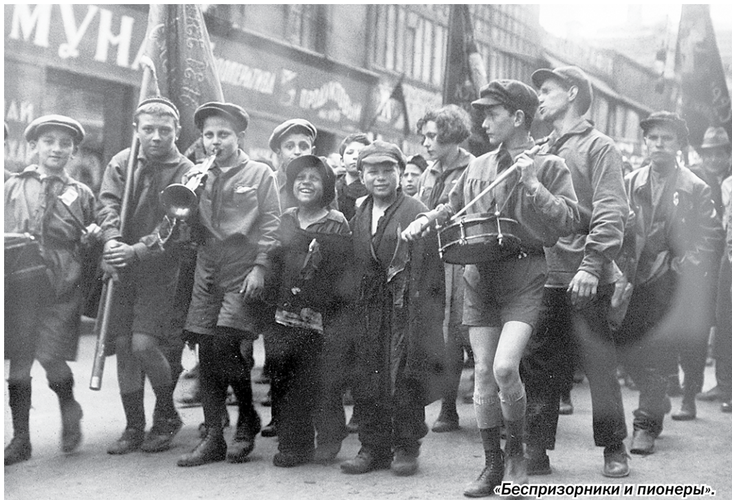
«Беспризорники и пионеры».

Он творил в Москве и Ленинграде. Начинать как журналист, позже выбрал совсем иной метод фиксации реальности. «Огонёк», «Советское фото», «Наши достижения», «СССР на стройке», – эти названия журналов, с которыми сотрудничал Игнатова, немало говорили о требованиях, которые предъявляло к фотографу время. Он был соратником Александра Родченко. В 1920-30-е находился в самой гуще жизни – в его объектив попадали и трудовые свершения, и будни рождающегося государства. Надо полагать, тогда Игнатова считал, что фиксирует процесс рождения нового человека.