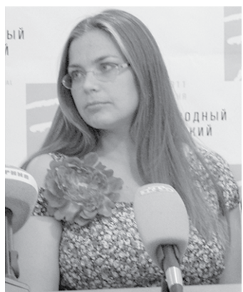
Актриса Ирина Пегова.