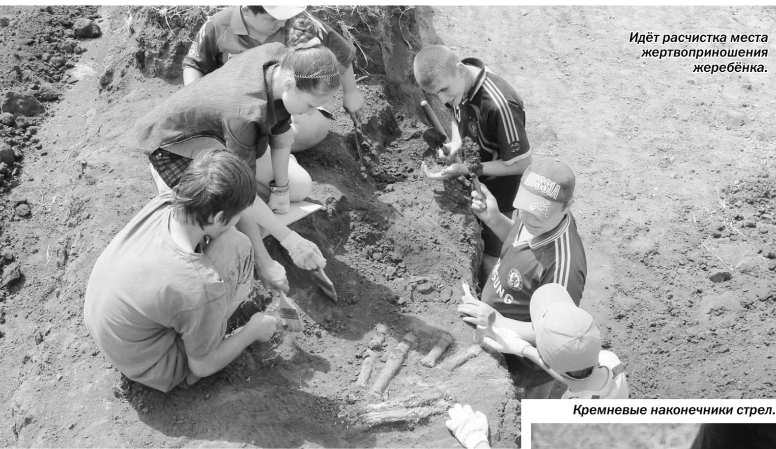
Идёт расчистка места жертвоприношения жеребёнка.

Субботный репортаж | Бронзовые стрелы помогли юным археологам вернуться к нашим истокам