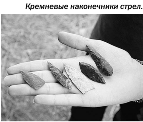
Кремневые наконечники стрел.

Подготовка к слёту начинается за полгода. Студенты из педагогического отряда, который тоже называется «Возвращение к истокам», придумывают конкурсы, викторины, вместе с Валерием Дмитриевичем подбирают такой ма-