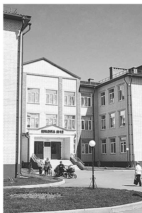
В прошлом году открыла двери новая школа.

В рамках конференции прошли и ещё два тематических «круглых стола», в которых принимали участие руководители департаментов правительства Воронежской области, руководители объединений работодателей,