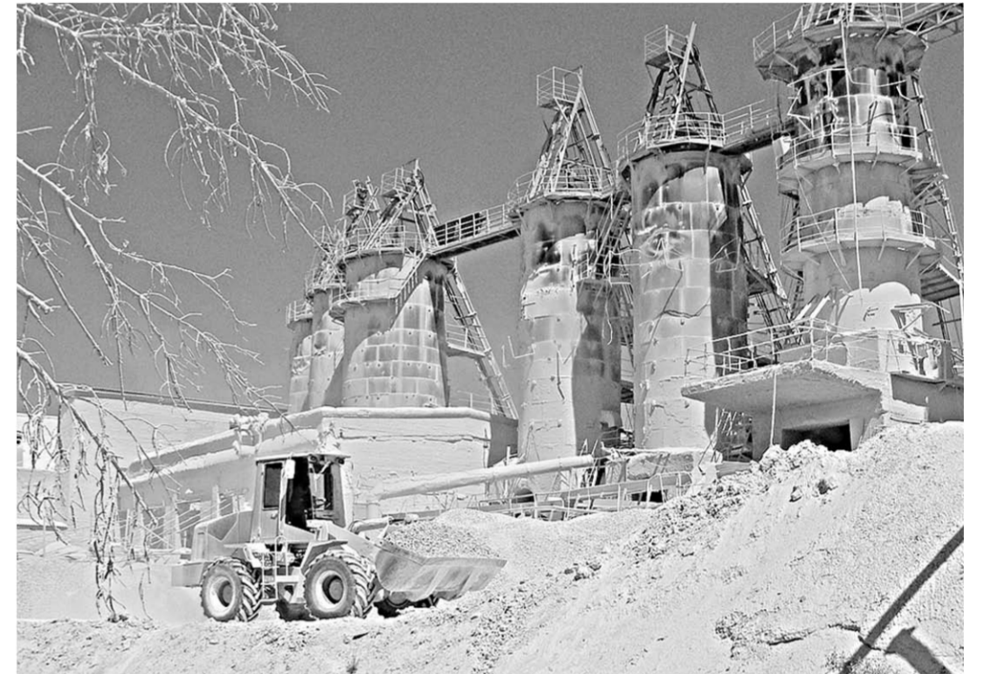
А гора всё выше...

Всё это в настоящем и будущем. Сейчас самое главное – это отсутствие вагонов, без которых труд четырёх с половиной сотен работников комбината в любой момент может свестись к нулю. Без вагонов в палитру будущего комбината потихоньку начинают просачиваться серые тона.