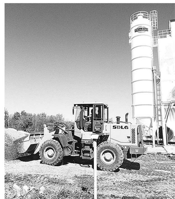
В мае в Борисоглебске пущен новый растворно-бетонный узел.