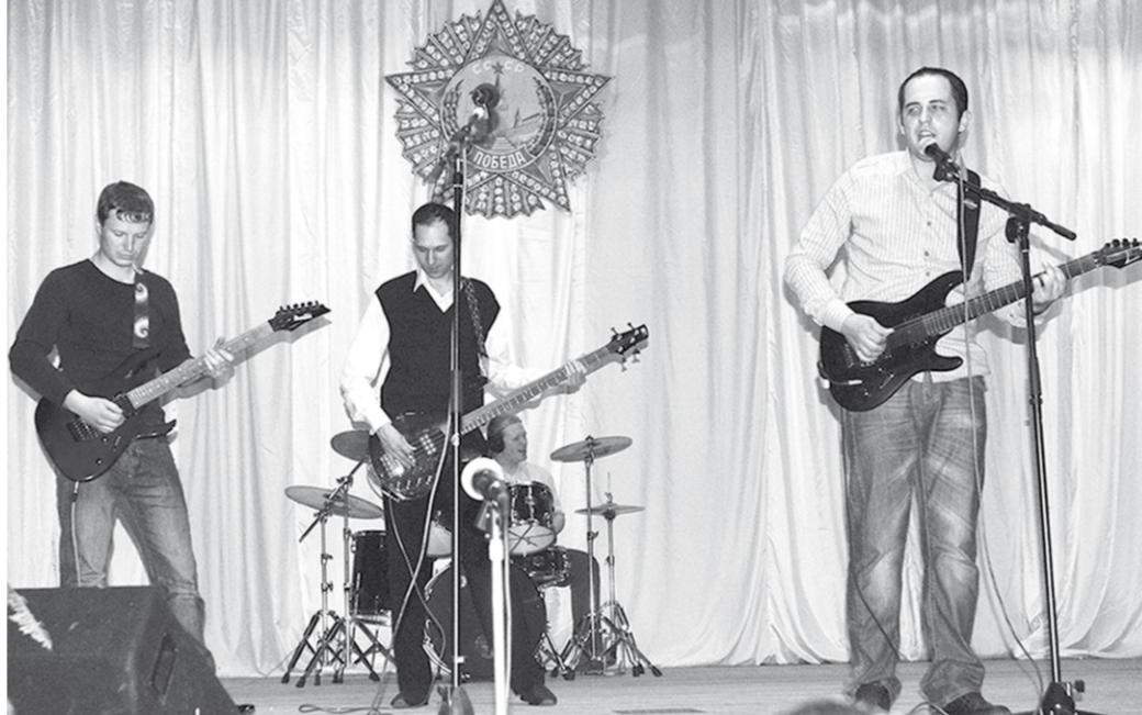
Заводская самодеятельность – на высоком уровне.

грамотно выполняешь свои обязанности и при этом уважаешь собственный труд в выбранной сфере. Зная, что за твоим трудом стоит честно заработанная зарплата, а не «серым конвертом», и мощный социальный пакет, которого нет на других предприятиях. Это некое внутреннее состояние, которое дорогого стоит. Уверен, что мода на юристов и экономистов, которые после окончания вуза идут в торговлю, пройдет. И настоящими героями дня станут рабочие, инженеры, конструкторы, участвующие в процессе создания продукции, а не её купле-продаже.