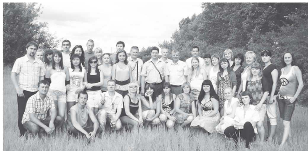
Хорошо работаем – хорошо отдыхаем.

– Работать на крупном производственном предприятии с каждым годом становится престижнее. Ведь престижная работа – это когда честно и