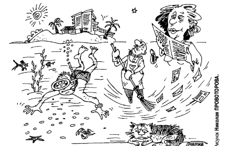
Рисунок Николая ПРОКОПОВА

В перспективе в городке, кстати, дали имя «Светофория», должны появиться светофор, медпункт и стационарный пост милиции. К работе по пропаганде безопасности дорожного движения руководство детсада планирует привлечь представителей автошкол.