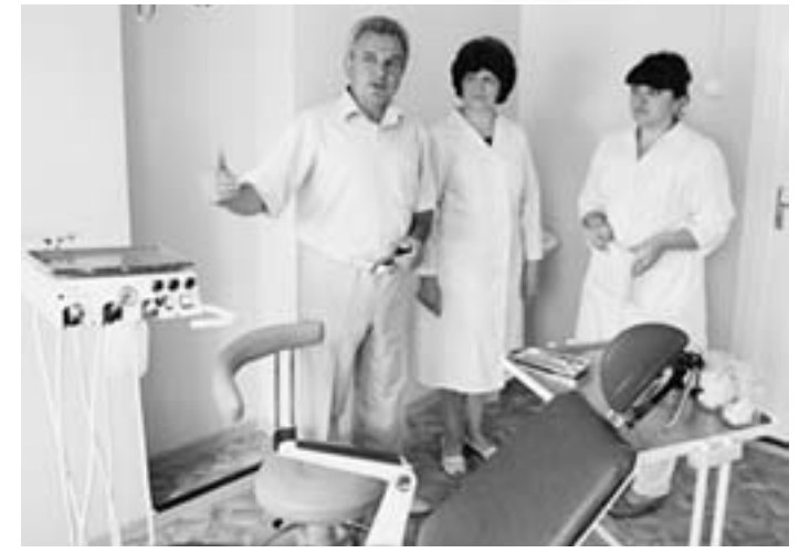
Кабинет для обслуживания инвалидов полностью готов к приёму пациентов.