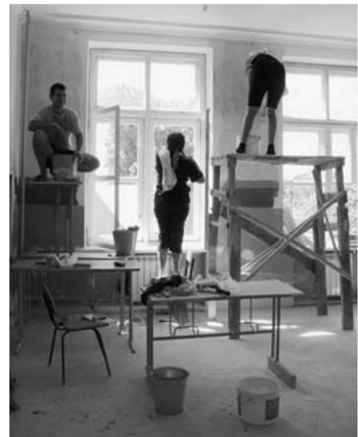
Родители учеников своими силами делают косметический ремонт.

Педсовет | Реконструкция Латненской средней школы, что в Семилукском районе, затянулась на три года