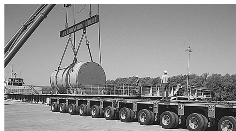
Реактор готовят к отправке от причала на стройплощадку.

Часа четыре ушло на то, чтобы погрузить и закрепить его на самодвижной модульный транспортер, и еще через час корпус реактора в целости и сохранности был доставлен