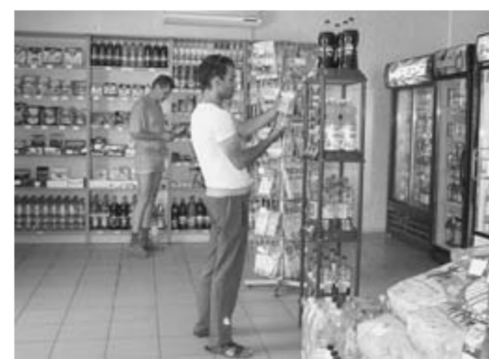
АЗС в селе Каширское, здесь работает просторный магазин с товарами повседневного спроса.

ООО «Предприятие «Управляющая компания» Филиал в Воронеже: т.: (473) 265-74-09; 222-41-35.