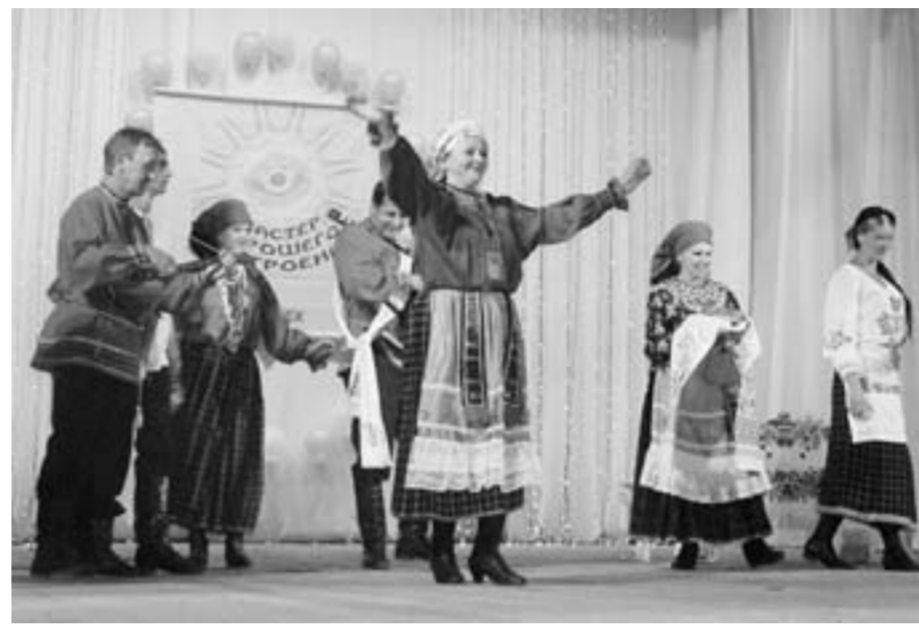
Конкурс «Наша хата утехами богата».

Областной фестиваль-конкурс профессионального мастерства работников клубных учреждений «Мастер хорошего настроения», организованный областным Центром народного творчества, в этом году проводился уже в третий раз. Стартовал он в июне в Репёвке. Следующие зональные смотры прошли в Ольховатке и Новой Усмани. А придуман этот конкурс был ради повышения престижа профессии и уровня профессионального мастерства культработников, с целью выявления и поддержки талантливых исполнителей и организаторов досуговой работы. В прежние годы победители представляли Воронежскую область на межрегиональных смотрах в Белгороде, Липецке и Тамбове.