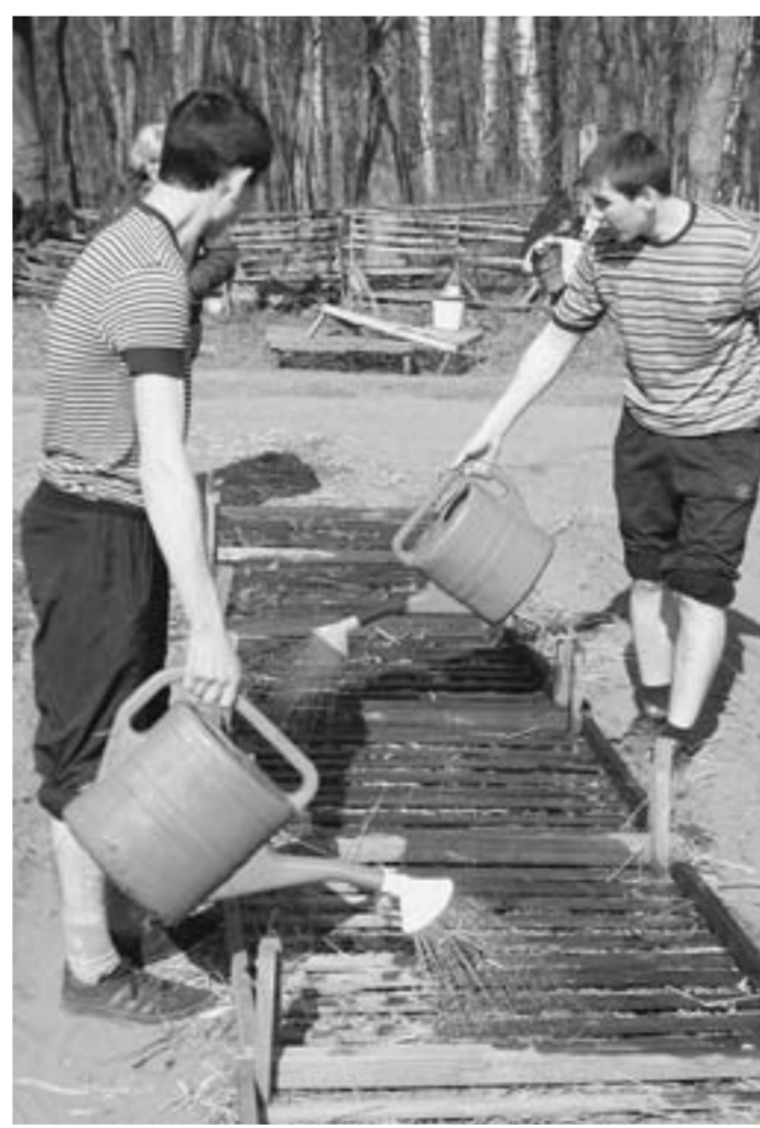
Студенты выращивают сеянцы для прошлогодних горельников.