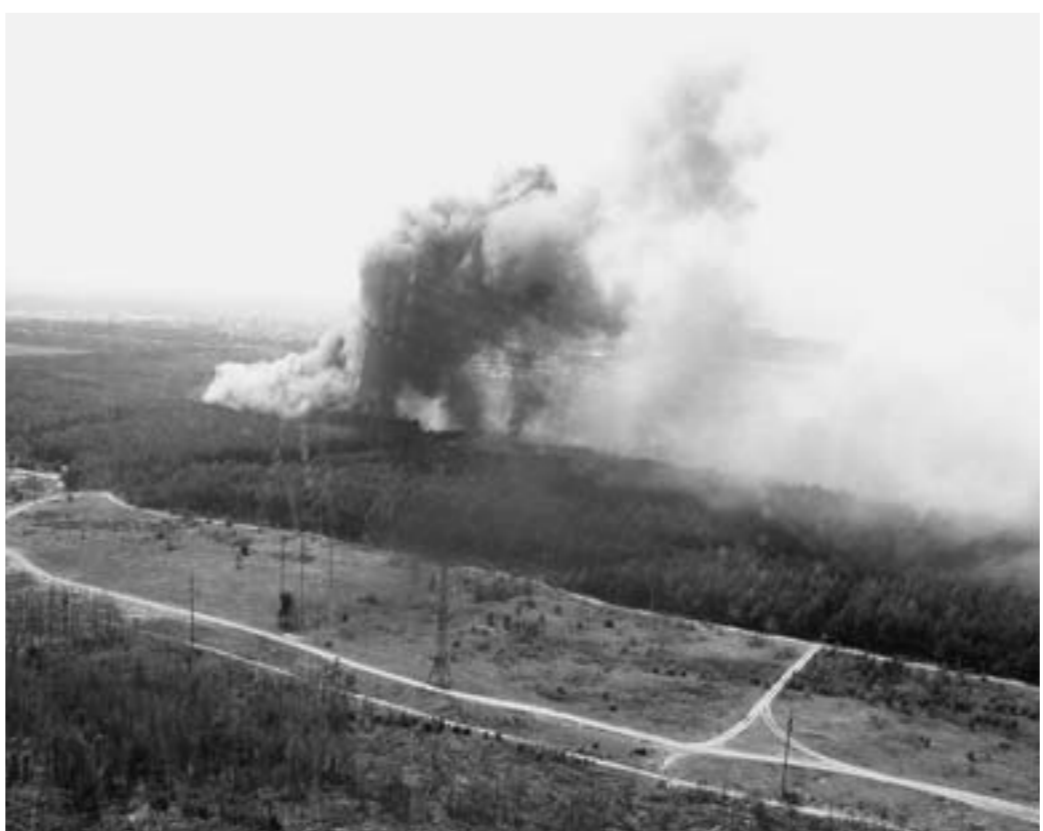
Жара и игнорирование правил безопасности стали причиной крупнейших лесных пожаров.

Лесные пожары в Воронежской области охватили территорию в 19,5 тысячи гектаров, из которых лесные насаждения на площади 12,7 гектара погибли полностью. Уничтожено 307 жилых домов и более 800 надворных построек в 19 населённых пунктах. Без крова над головой остались 772 человека. Это 347 семей.