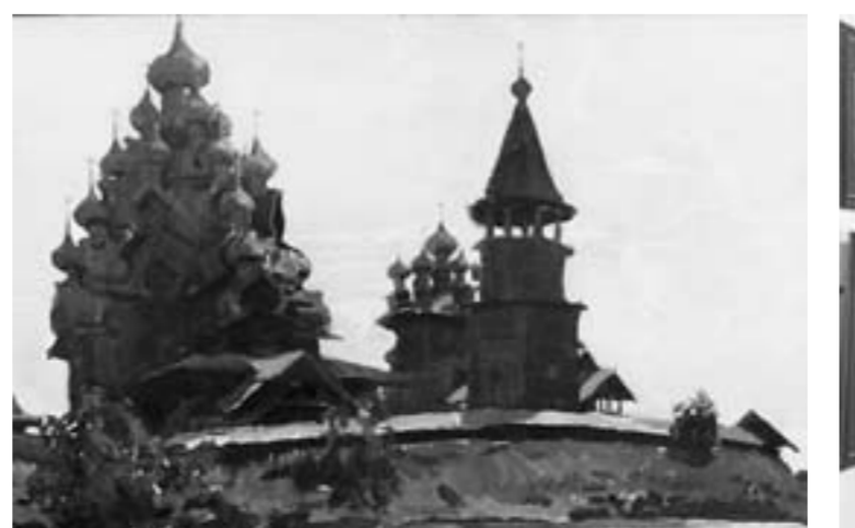
«Кижки в солнечный день».