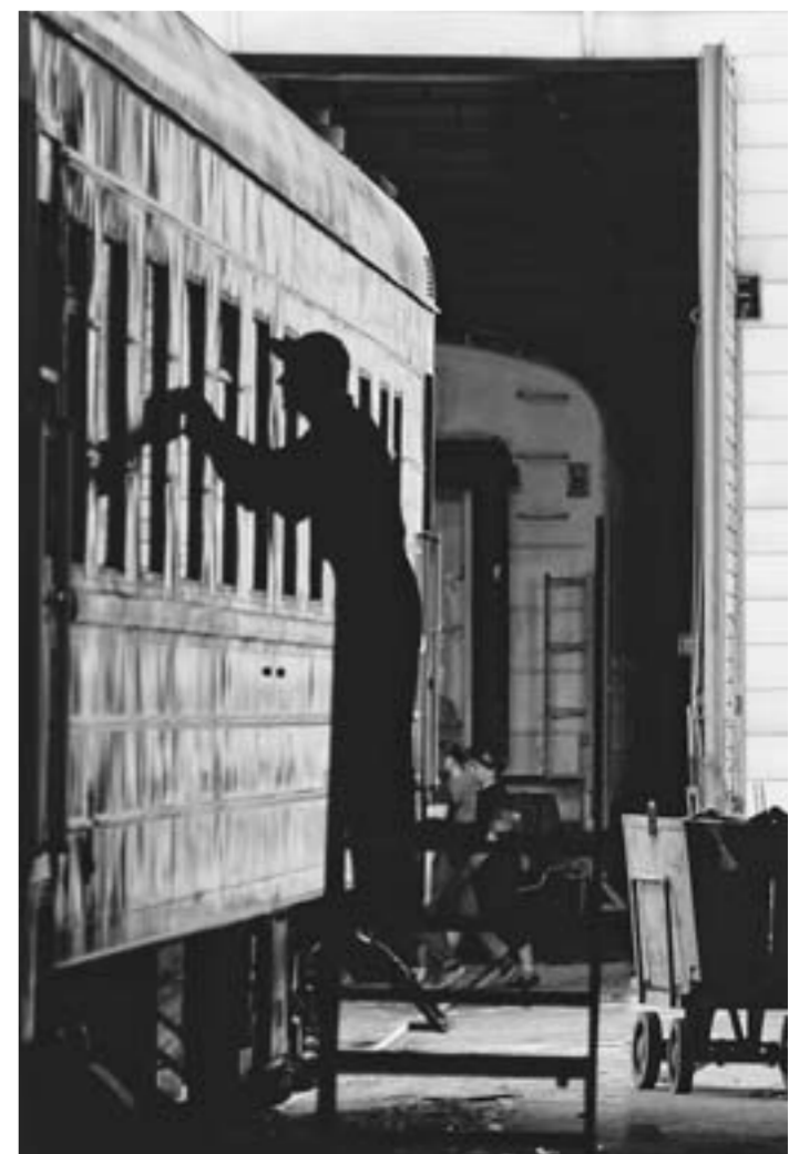
Внешняя отделка вагона.