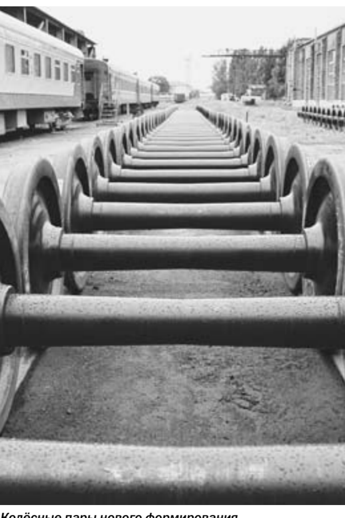
Колёсные пары нового формирования, подготовленные для отгрузки.