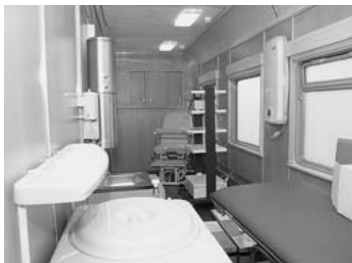
Один из вагонов поезда «Здоровье».