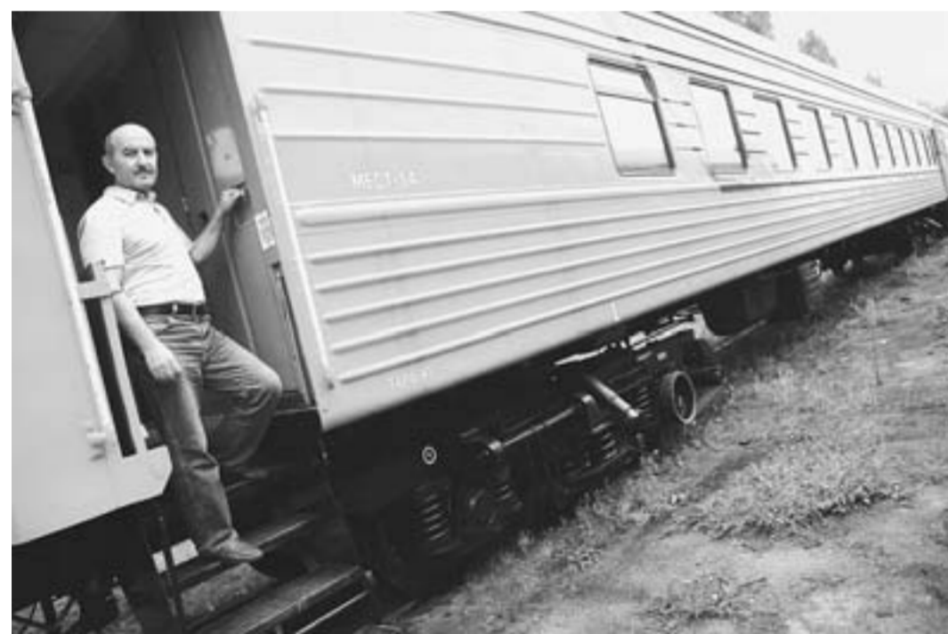
Отремонтированный на заводе вагон отправляется в Армению.

Эти факты как мозаика складываются в трудовые будни, когда нет мелочей и на счету каждая минута. Когда одинаково важны стратегия и тактика на единственно верном направлении - на пути инновационного развития. Завод