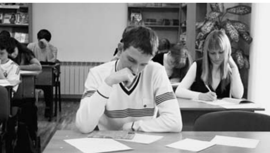
Сочинение написать - не поле перейти.

Образовательный стандарт вызвал острую реакцию в профессиональном сообществе и обществе в целом. «Реформы, предлагаемые министерством, дают возможность получить высшее образование только избранным, вызовут расслоение образования на «креативное» и «компетентное». Новые стандарты не подкреплены системой обучения». «ЕГЭ полностью исключает устную