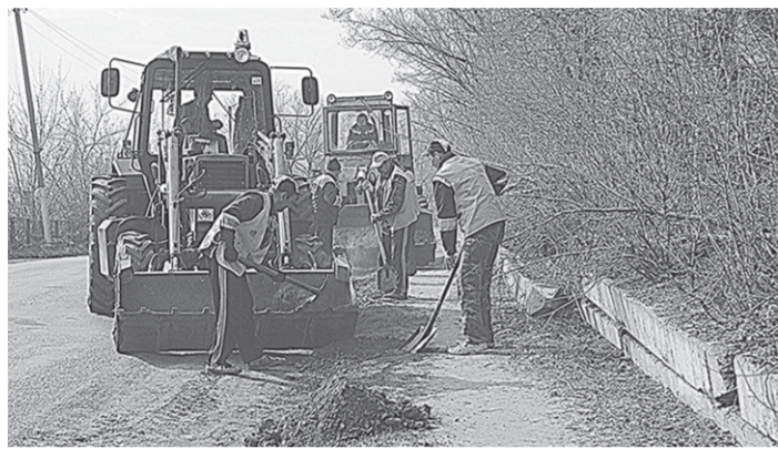
Ремонт на трассе.

Обслуживанием и ремонтом автомобильных дорог в Нижедевицком районе занимается ООО «Нижедевицкавтодор». Уже выполнены работы на автомобильной дороге Нижедевицк-Синие Липяги-Остриянка-Скушая Потудань, Нижедевицк-Новая Ольшанка, а также трассы, ведущей до села Кучугуры. Уделяется внимание и благоустройству улиц райцентра. Капитально отремонтирована проезжая часть улиц Революционная, Воронежская, Братев Серых. Установлено 139 новых щитков дорожных знаков и два автопавильона в селе Глазово.