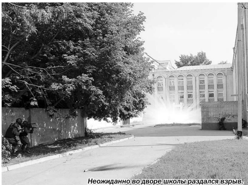
Неожиданно во дворе школы раздался взрыв.