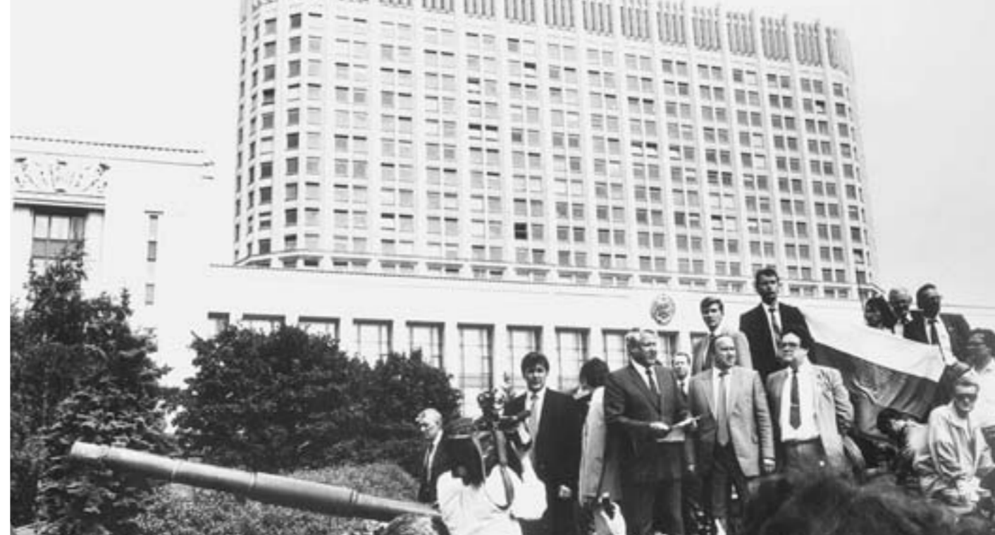
Президент РСФСР Борис Ельцин во время выступления 19 августа 1991 года у здания Совета Министров РСФСР.

Вот – август 91-го: «На стороне Кремля были те же атри-