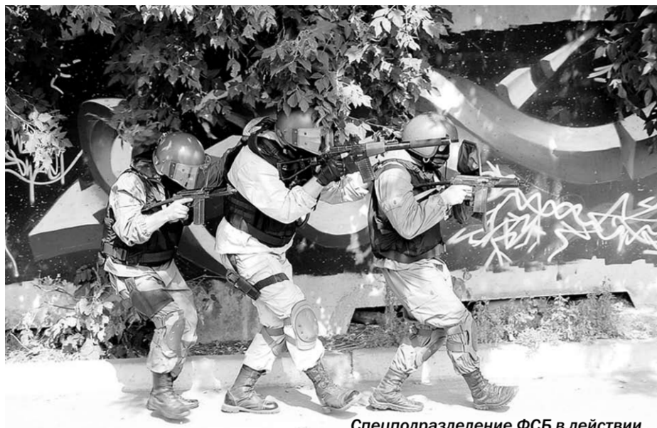
Спецподразделение ФСБ в действии.

Учения | Вчера в Воронеже прошло очередное учение оперативного штаба антитеррористического комитета Воронежской области