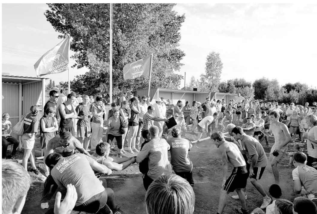
Перетягивание каната стало самым ярким зрелищем праздника.