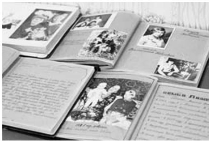
Фотоальбомы – летопись кантемировских семей.

Летом по здешним крутогорам, ведущим к реке, он бегал со своими одноклассниками в догоналки, начисто отринувшись от школьных забот. Но подходило 1 сентября, а вместе с ним и желание что-то нарисовать для стенгазеты и журнала. «Ему интересно было рисовать даже такой «нехудожественный» мотив – вешалку в углу класса с грудой пальто и плушубков, - замечает искусствовед Е.Жукова. - Потребность рисовать была связана с ощущением чужда: из линий и штрихов, если приложить старание и разобраться, как одно с другим соотносится, может получиться знакомое лицо или родная улица. В пейзаже он старательно воспроизводил каждое окно, дерево, «пересчитывая» все