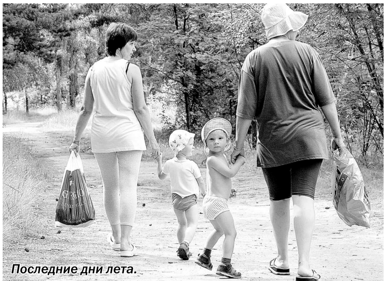
Последние дни лета.

из лагеря было госпитализировано 18 детей и один вожатый в возрасте 16 лет. Всего было зарегистрировано 25 пострадавших. Состояние всех детей медики оценивают как удовлетворительное. Несколько из них родители забрали домой под расписку. В прошлый четверг областной Роспотребнадзор закрыл лагерь, смена в котором должна была закончиться 29 августа.