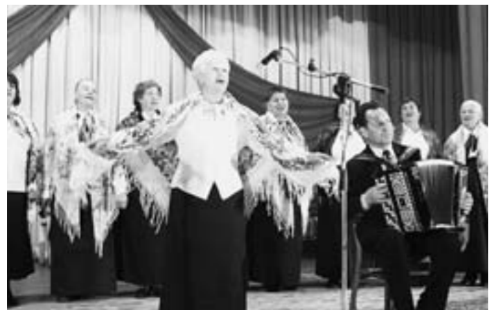
На сцене – хор клуба «Надежда».