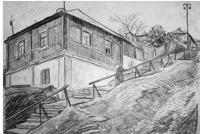
«Спуск к реке», 1973.