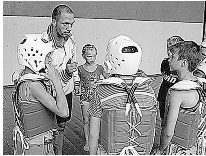
– Если взять младшую группу, то важно, чтобы они научились друг с другом общаться. Поэтому стараюсь делать упор не только на физподготовку, но и на личностное развитие каждого ребёнка. Приучаю их к дисциплине. Если с детства в человеке заложить эти качества, ему будет легче в жизни.

Да и отрывать детей надо от компьютеров, телевизоров и дурного влияния улицы. В секции сегодня занимается около 40 детей. Тренировка не ограничивается только спортом, мы проводим её и на свежем воздухе. Думаю, пройдёт год-два, и эти ребята достойно себя покажут на представительных соревнованиях.