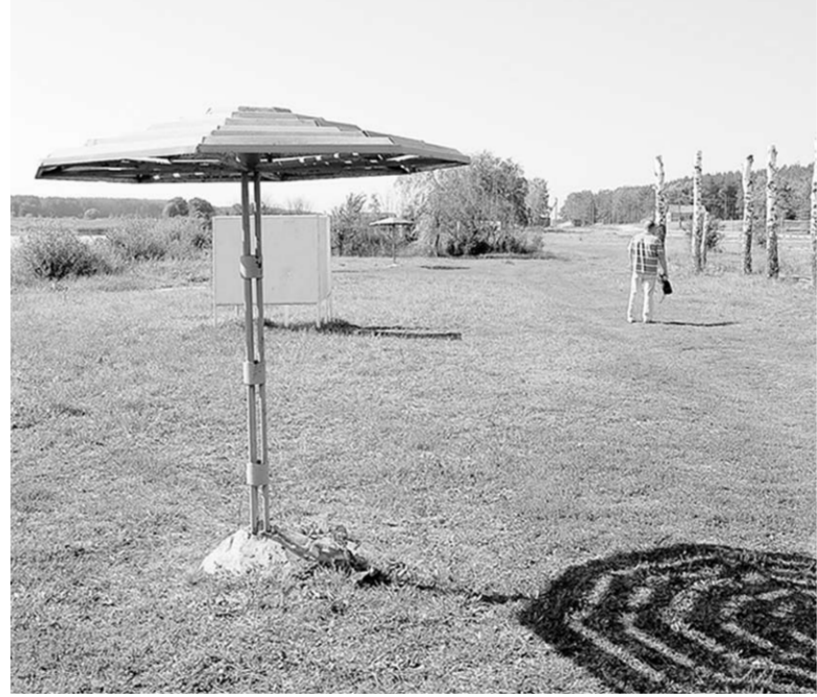
Импровизированный пляж на сельскохозяйственных угодьях — источник разногласий Росреестра и владельца земли.

В итоге собственнику пришлось подписать протокол об административном нарушении, чтобы вскоре оплатить очередной штраф. Сейчас ему остаётся только ждать, когда запутанная ситуация придёт к логическому завершению.