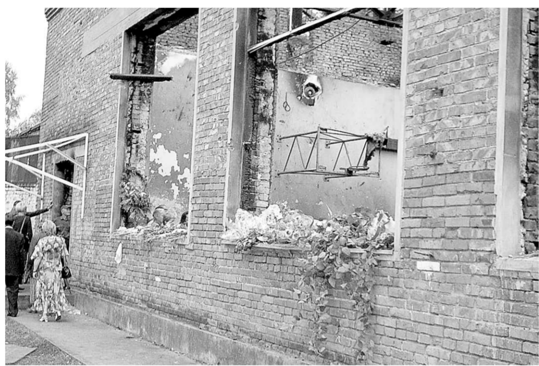
На месте трагедии всегда живые цветы, мягкие игрушки, бутылки с водой...