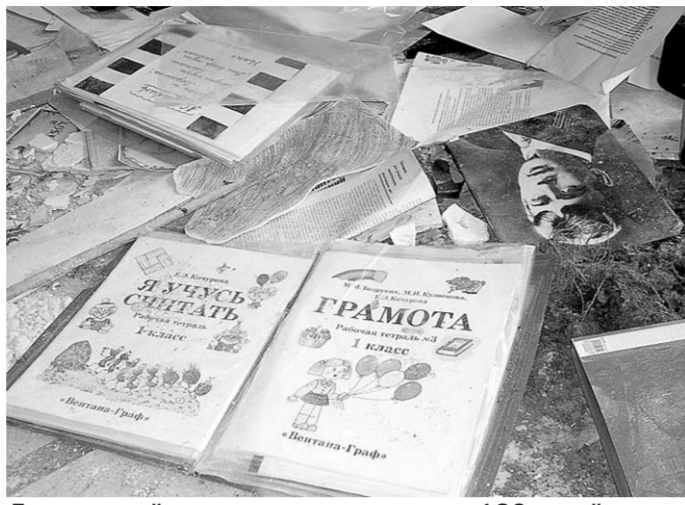
День знаний стал последним в жизни 186 детей.

тели соседних республик, известный детский врач Леонид Рошаль... Переговоры шли с переменным успехом. А потом, на третий день, в 13.05 возле здания школы прогремели два мощных взрыва. Началась ожесточенная перестрелка. И штурм... Научил ли нас чему-нибудь Беслан? Какие уроки мы извлекли из этой трагедии? Стали ли после этого хотя бы чуточку лучше, мудрее?