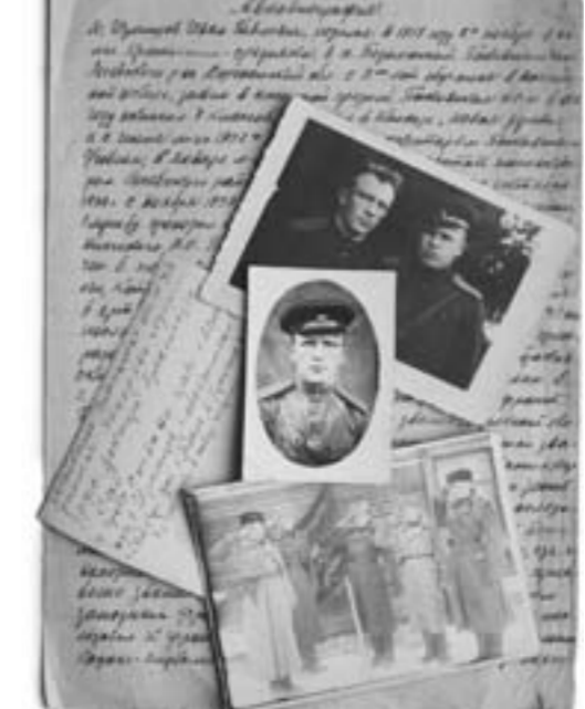
Вот такие они, фронтовые фотокарточки.