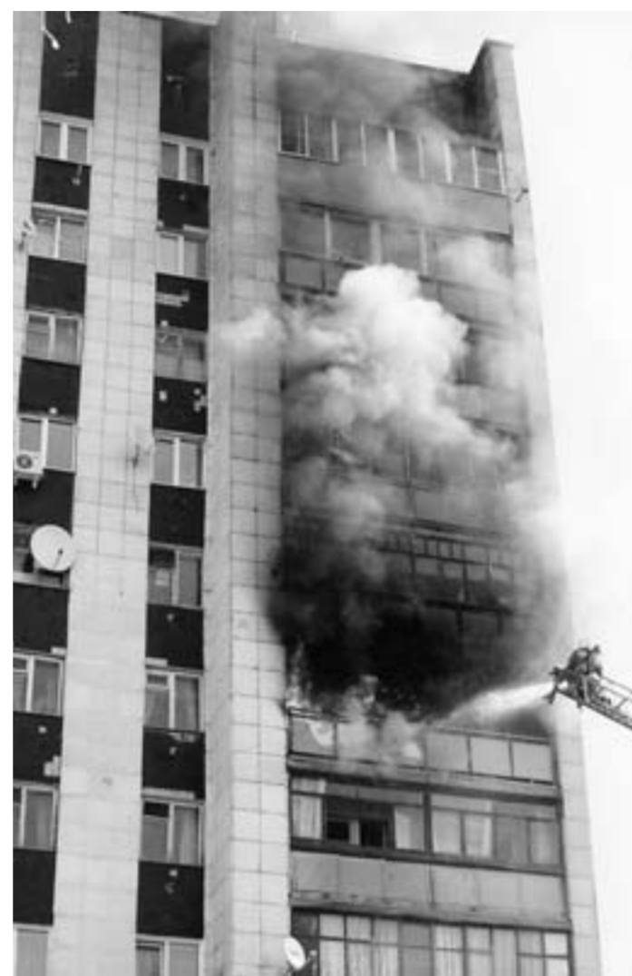
Горит многоквартирный дом на улице Серафимовича.

Все труднее становится огнеборцам и оперативно