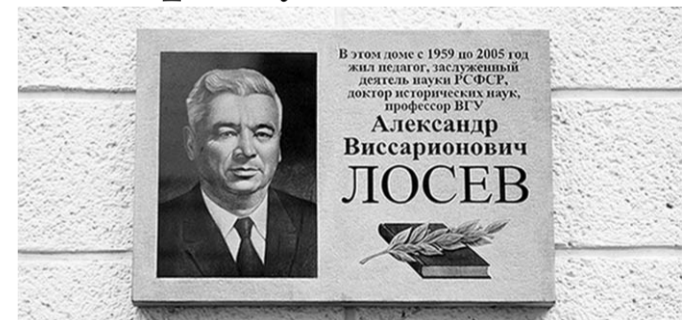
В Воронеже открыта мемориальная доска Александру Лосеву.