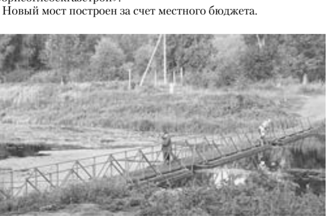
На понтонном мосту часто можно видеть местных рыбаков.

Старый понтонный мост совсем протривал и лег на дно реки. Жители Борисоглебска написали письма в администрацию городского округа с просьбой восстановить его. Изучив ситуацию на месте, было принято решение поставить новый мост, так как реконструкция старого обоилась бы дороже, чем строительство нового. Был проведен тендер. В результате за работу взялось ЗАО «Борисоглебскагострой».