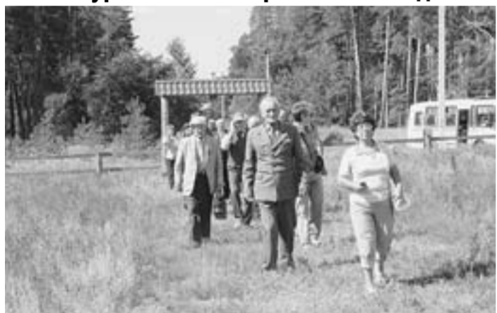
Борисоглебские ветераны на экскурсии в Варварино.