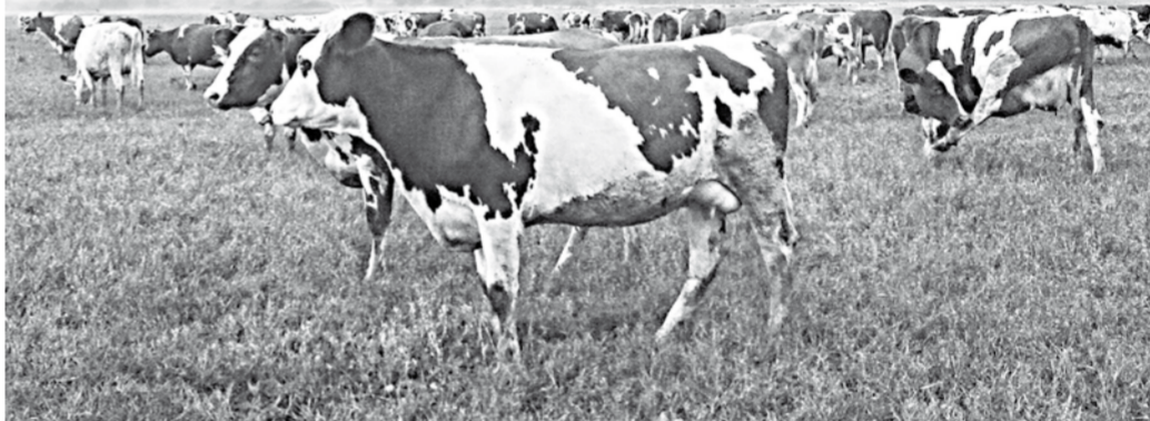
О качестве воронежского молока заботится сама природа.

– Сейчас ориентируемся в своей работе на то, чтобы