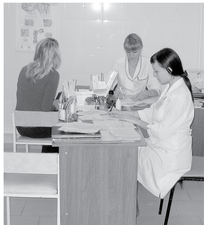
В кабинете у детского и подросткового гинеколога.

Акушеры-гинекологи нашего центра работают по принципу специализированных приемов. Это позволяет решать проблему каждого пациента более тщательно, нежели при консультации акушера-гинеколога общей практики.