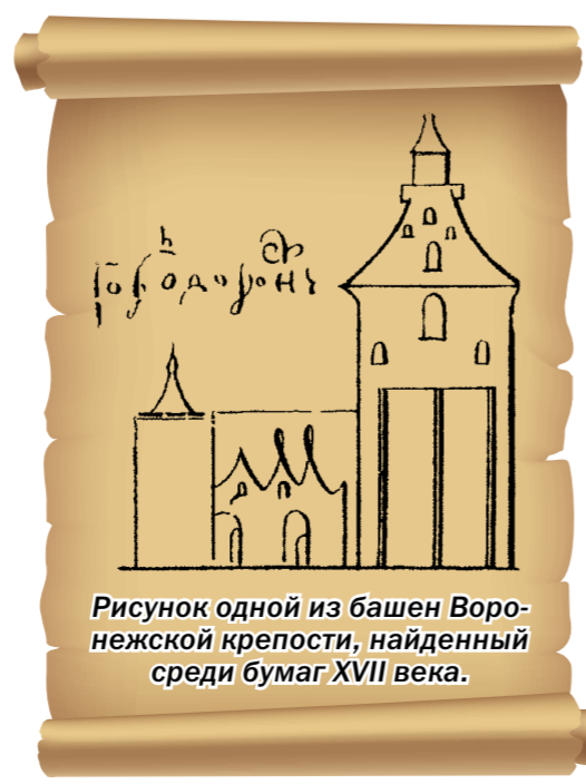
Рисунок одной из башен Воронежской крепости, найденной среди бумаг XVII века.

К сожалению, в Воронеже, в отличие от других городов, нет памятника или памятного знака в честь основателя города. Идея возвести памятник воеводе С.Ф. Сабурову пока далека от практического воплощения. На мой взгляд, такой памятник украсил бы наш город и расширил список его достопримечательностей.