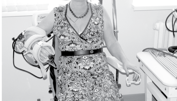
В зале лечебной физкультуры.