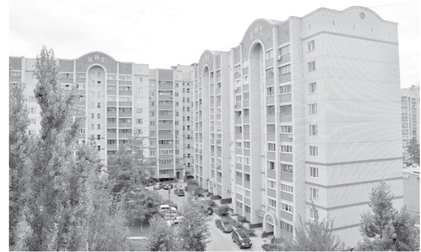
В год «китовцы» сдают городу 60-80 тысяч квадратных метров жилой площади.