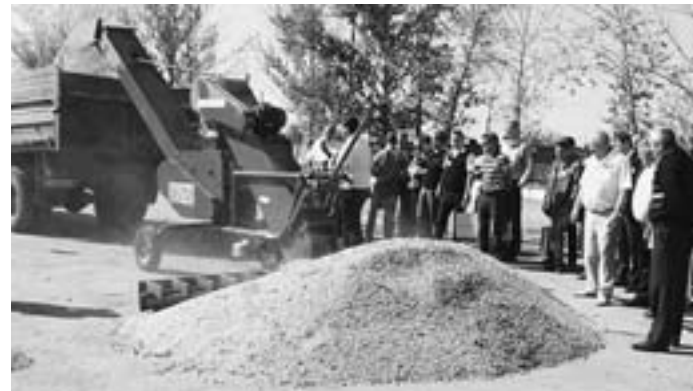
Техника Ростсельмаш помогает аграриям и растить урожай, и убирать, и хранить его.

ки для оперативной перегрузки зерна в местах его хранения. Многие из аграриев, например, знают о быстро монтируемых мобильных сборно-разборных колёсных зернохранилищах, но стационарные загрузочно-разгрузочные механизмы «утяжелют» их стоимость чуть ли не в два раза. Вот бы эти механизмы полегче, мобильнее, универсальнее!