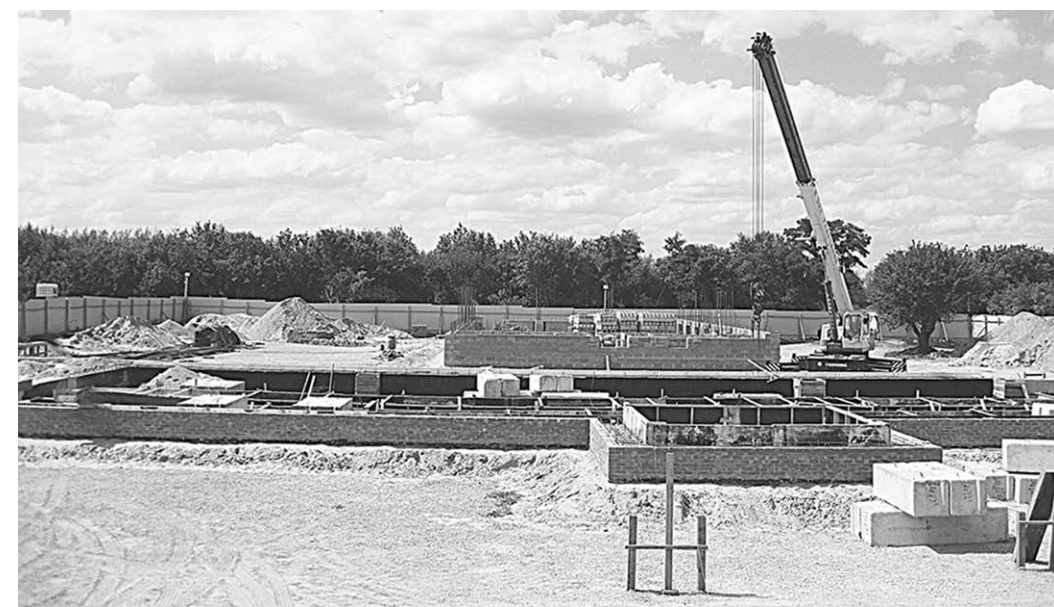
Фундамент школы заложили в августе. Сейчас здесь уже стоят стены.

В сложившейся ситуации сельчане решили, что им смо-