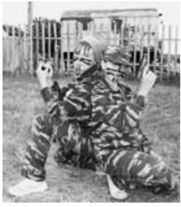
Они были в лагере «Казачок».