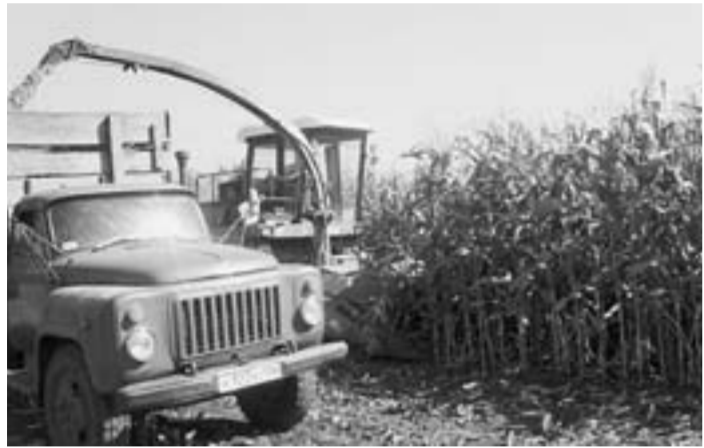
Идет уборка кукурузы на силос.

При урожайности 500 центнеров зеленой массы с гектара ежедневно закладывали около 450 тонн силоса. Вся зеленая масса обрабатывалась консервантами, тремболом, затем укрывалась полиэтиленовой пленкой и хранится в специальных ямах рядом с молочнокислыми фермами. Отрасль животноводства ООО «Агротех-Гарант «Пугачевский» полностью обеспечена кормами на предстоящую зимовку.