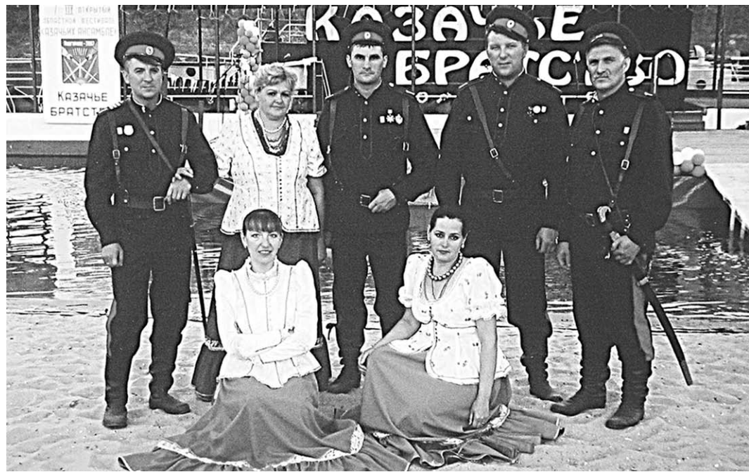
Новохоперские певцы из «Пристанского».

И более ничего не сказал, но этим было всё сказано. Лучше бы тот тип из сквера оказался шпионом, чем халелем.