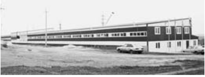
Ноябрь 2011 года. Цеха уже действуют.

В «Кедре» около 200 работников, большинство из которых – семилуки. В перспективе будет 350 сотрудников.